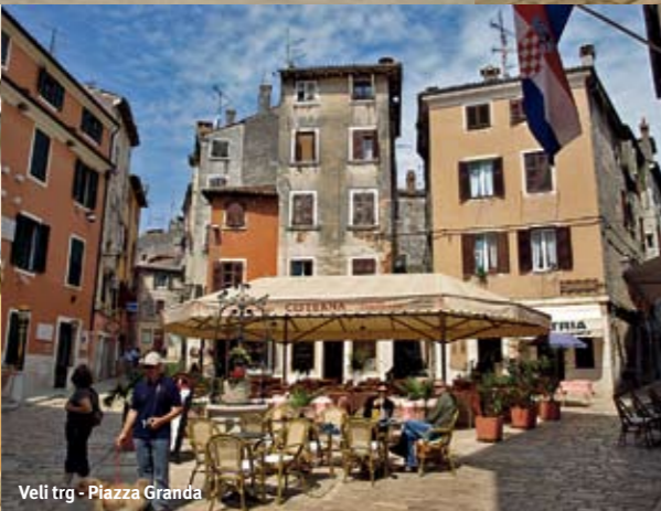
Veli trg - Piazza Granda