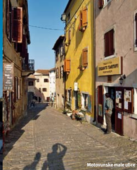
Motovunske male ulice