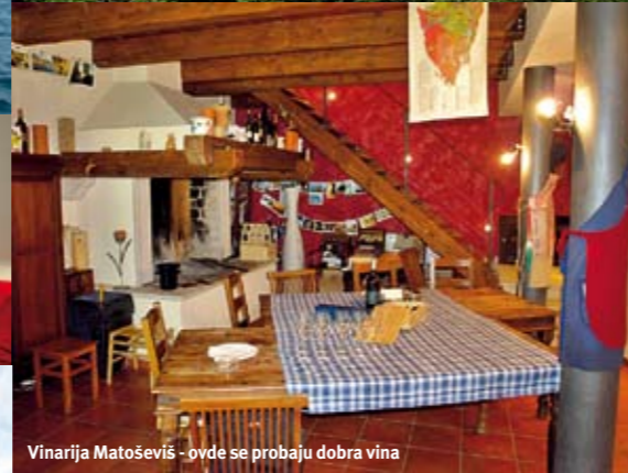
Vinarija Matošević - ovde se probaju dobra vina