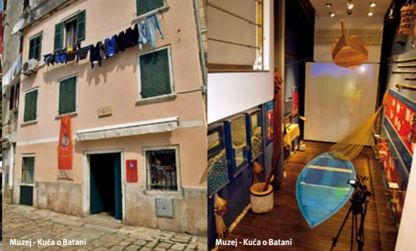
Muzej - Kuća o Batani