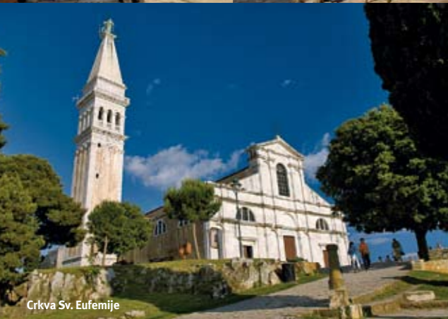
Crkva Sv. Eufemije