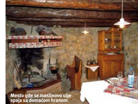
Mesto gde se maslinovo ulje spaja sa domaćom hranom