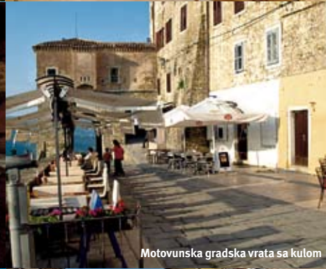
Motovunska gradska vrata sa kulom