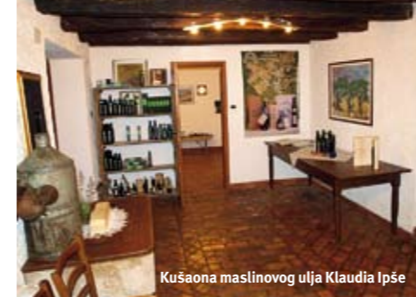
Kušona maslinovog ulja Klaudia Ipše

Nastavljajući naše putovanje kroz unutrašnjost Istre, bazirano na kulinarsko-enološkim osnovama, uputili smo se u selo