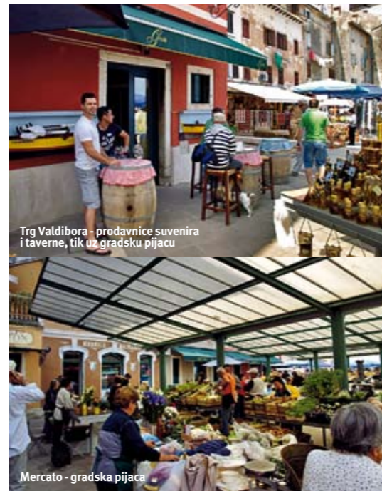
Trg Valdibora - prodavnice suvenira i taverne, tik uz gradsku pijacu

Ipak, odmah na početku - jedan savet: obavezno slušajte hrvatski radio i obavestjenja njihovog auto-moto saveza, jer se često dešava da ima nekih radova na putevima, te se može desiti da morate da koristite alternativne pravce! A to ponekad može biti i veoma korisno... Zbog radova na tunelu iznad Rijeke, koji je i napravljen da bi se grad zaobišao i gde magistralni put A6 prelazi u A7, bili smo prinuđeni da prodemo kroz Rijeku. Put nas je vodio kroz sam centar i kroz divna naselja na okolnim uzvišenjima sa kojih se pružao sjajan pogled na more, tako da smo usput "prinudno" delimično upoznali i Rijeku. Da budem u potpunosti iskren, pomislih