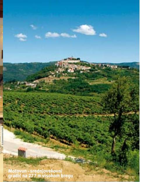
Motovun - srednjovekovni gradić na 277 m visokom bregu