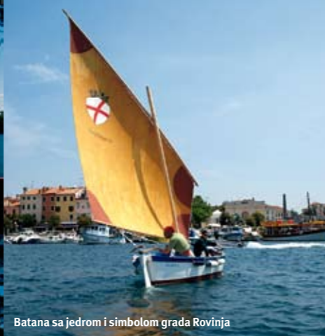
Batana sa jedrom i simbolom grada Rovinja