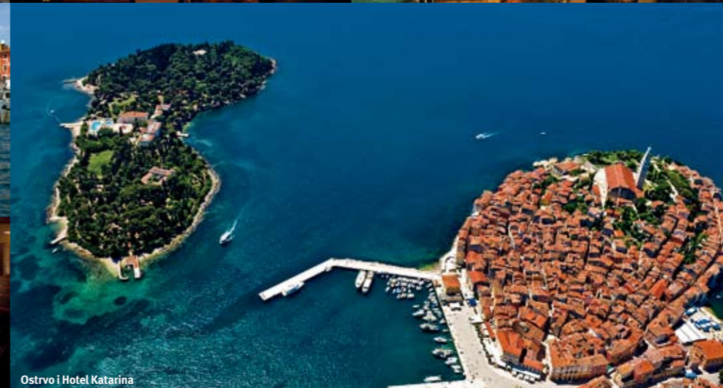
Ostrvo i Hotel Katarina