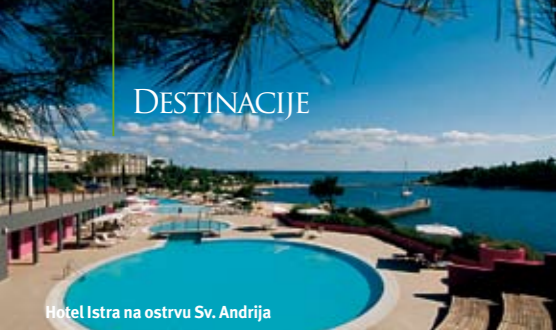
Hotel Istra na ostrvu Sv. Andrija