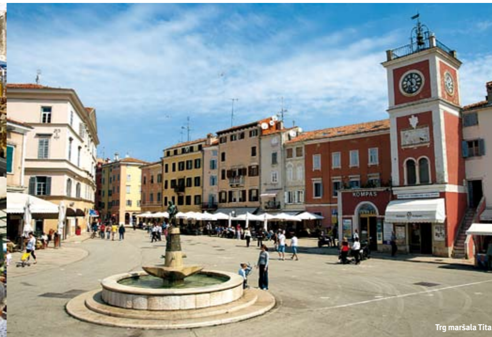
Trg maršala Tita