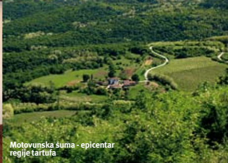
Motovunska šuma - epicentar regije tartufa