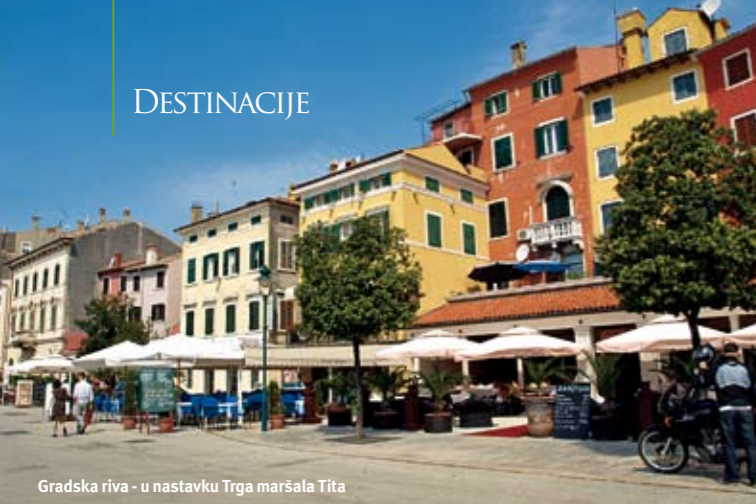
Gradska riva - u nastavku Trga maršala Tita