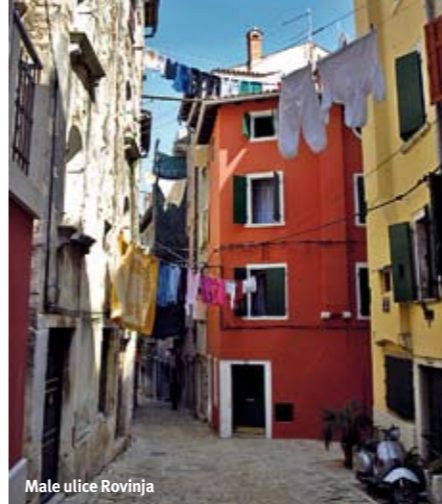
Male ulice Rovinja

koji je kopija tornja Sv. Marka u Veneciji, služi i za pokazivanje pravca vetra, s obzirom na to da se statua okreće oko svoje ose. Odavde se pruža i najlepší pogled na grad, njegovu okolinu i okolna ostrva.