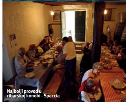
Najbolji provod u ribarskoj konobi - Spaccia