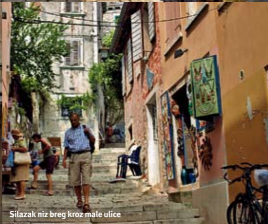
Silazak niz breg kroz male ulice

važnijih događaja u gradu, dok otkucaji sata na njegovom tornju i dalje odzvanjaju u ritmu svakodnevice. Trg se poput levka otvara prema gradskoj luci Sv. Katarine , gde su usidrene brojne tradicionalne barke - batane, kao i turistički brodovi koji turistima nude obilazak okolnih ostrva i grada sa mora. Danas se na trgu okupljaju mnogobrojni turisti koji ovde planiraju svoje dalje obilaske, dok Rovinjani uživaju u međusobnim razgovorima u okolnim kafanama... Tokom leta se na trgu održavaju razni koncerti i predstave, povorke i performansi, tako da je uvek živo i veselo.