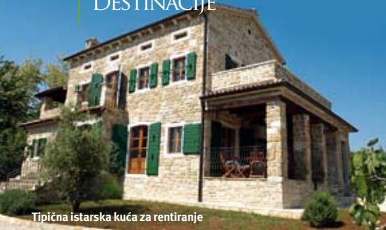
Tipična istarska kuća za rentiranje