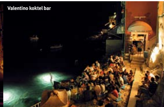
Valentino koktel bar