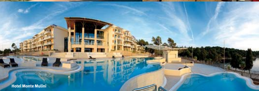
Hotel Monte Mulini