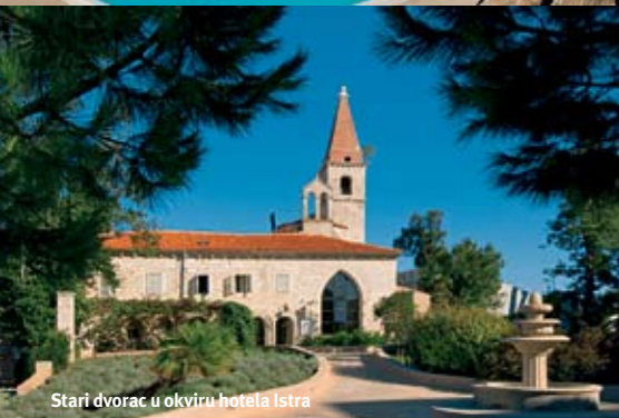
Stari dvorac u okviru hotela Istra