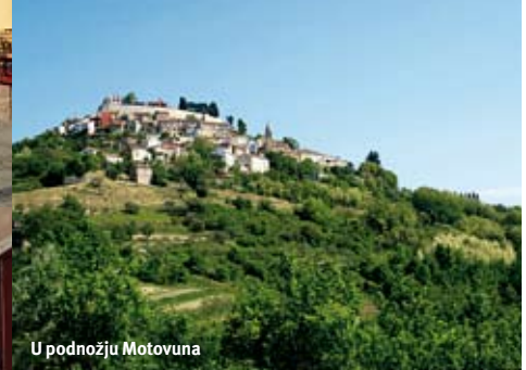
U podnožju Motovuna