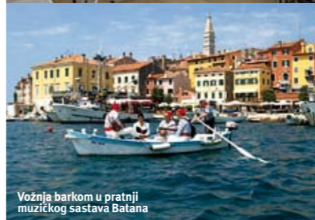
Vožnja barmom u pratnji muzičkog sastava Batana