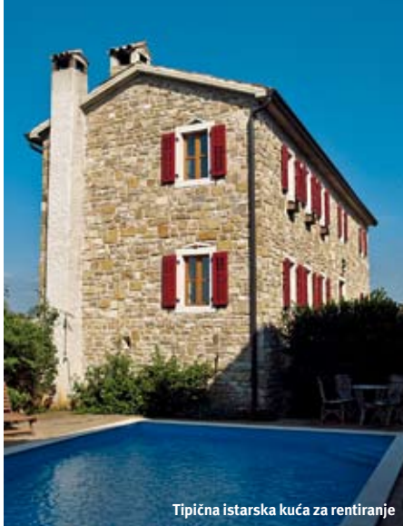
Tipična istarska kuća za rentiranje