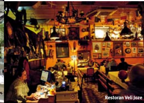
Restoran Veli Joze