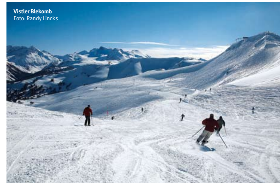
Vistler Blekomb

od svega nekoliko sati do nekoliko dana. Uz iskusne instruktore skijanja i snoubordinga zagarantovano ćete početi da skijate.