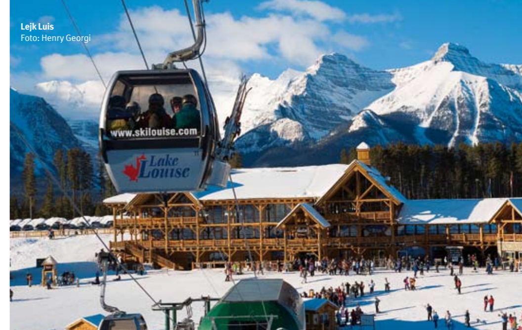
Lejk Luis

tog jezera i nikako ne idu jedno bez drugog. Zagarantovano vam je nezaboravno iskustvo prilikom odsedanja u ovom super delux hotelu "starog šarma" sa najlepšim pogledom u prirodu.