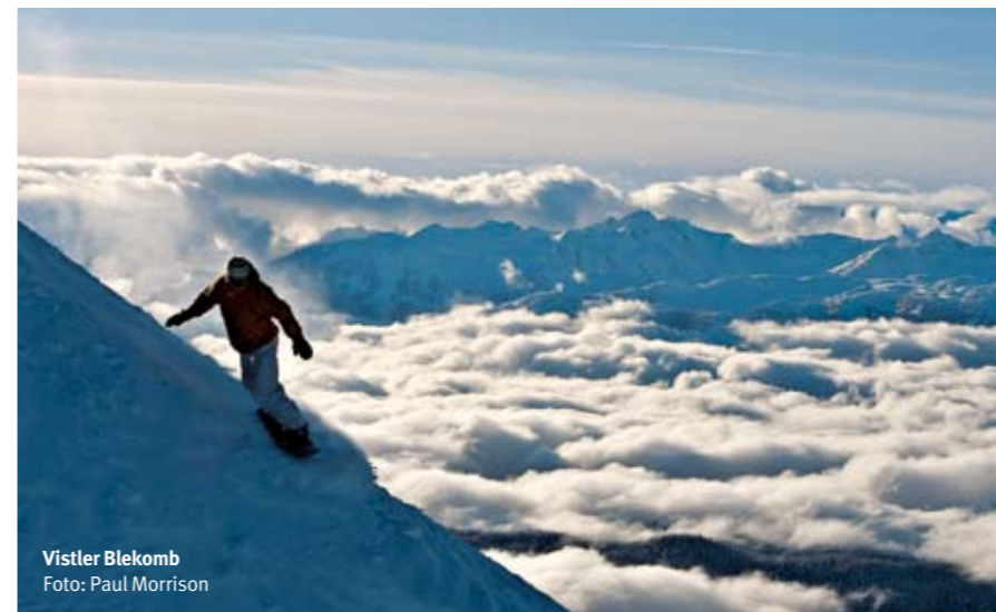
Vistler Blekomb

Vistler-Blekomb ima najveću skijašku površinu u Severnoj Americi, čak 32 kvadratna kilometra, 200 registrovanih skijaških staza, 38 liftova koji imaju kapacitet