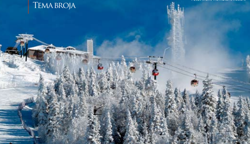
Mon Tromblon