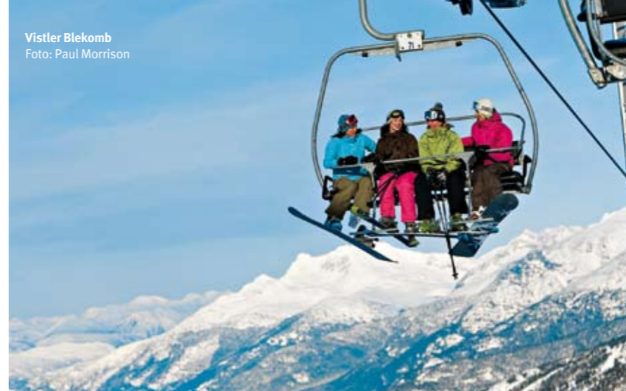
Vistler Blekomb

deri odlučuju da posete Vistler-Blekomb.