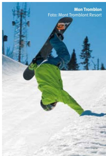
Mon Tromblon

jednog ili dva dana i pored teorije koju pokriva, nudi vam se i odlazak u izolovanije krajeve planina i pokušaj skijanja u otežavajućim uslovima. Ski savez Kanade je 2002. godine uveo obavezno nošenje kaciga za decu do 12 godina. Danas se sve češće može videti da i odrasli, u želji da daju dobar primer deci, nose kacigu za skijanje i snoubording.