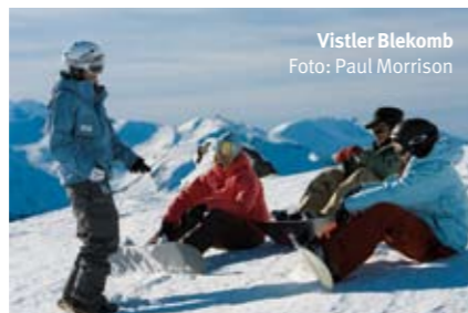
Vistler Blekomb