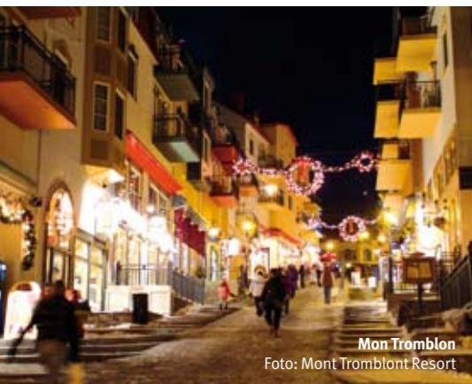
Mon Tromblon