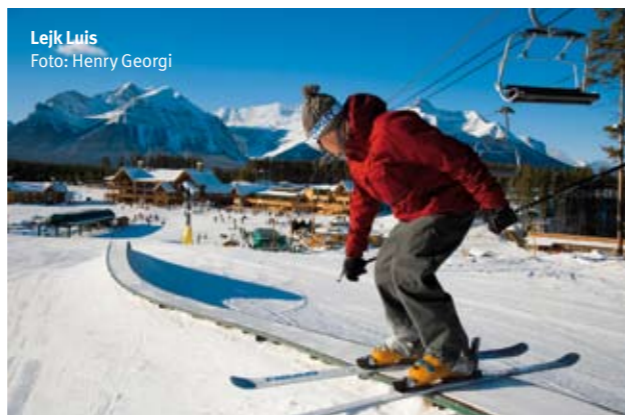
Lejk Luis

Ski centar Mon Tromblon se nalazi na nadmorskoj visini od 265 metara, s tim da je jedan od najviša tačka na 875 metara. Zimska sezona počinje u novembru i traje do aprila. Planina Mon Tromblon ima tri glavne skijaške strane, a svaka od njih se sastoji od velikog broja skijaških staza koje se razlikuju po težini. Ukupno ih je 94, od čega je 17 staza za početnike, 31 se vodi kao "srednja po težini", dok su preostale staze za iskusne skijaše i za sve koji žele veći izazov.