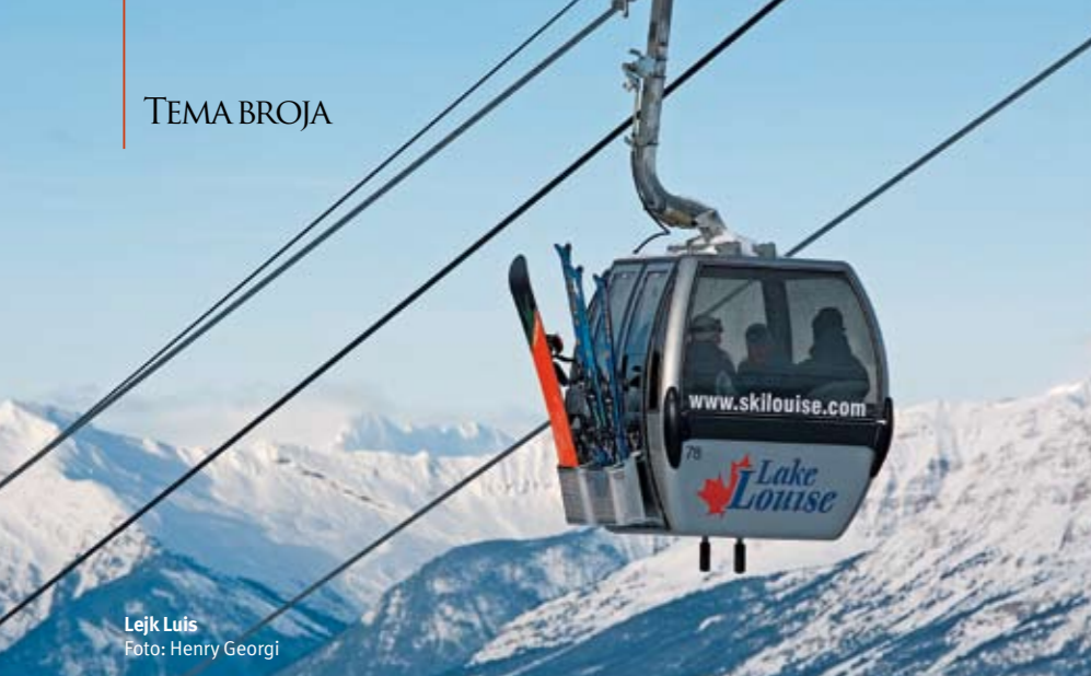
Lejk Luis

mnogobrojnih atributa, i zbog velike količine suvog, puderastog snega koji omogućava skijanje od početka novembra do kraja aprila. Cena jednodnevnog ski pasa je 72 kanadska dolara, za omladinu do 18 godina 50 dolara, a za najmlađe (od šest do 12 godina) je 24 dolara.