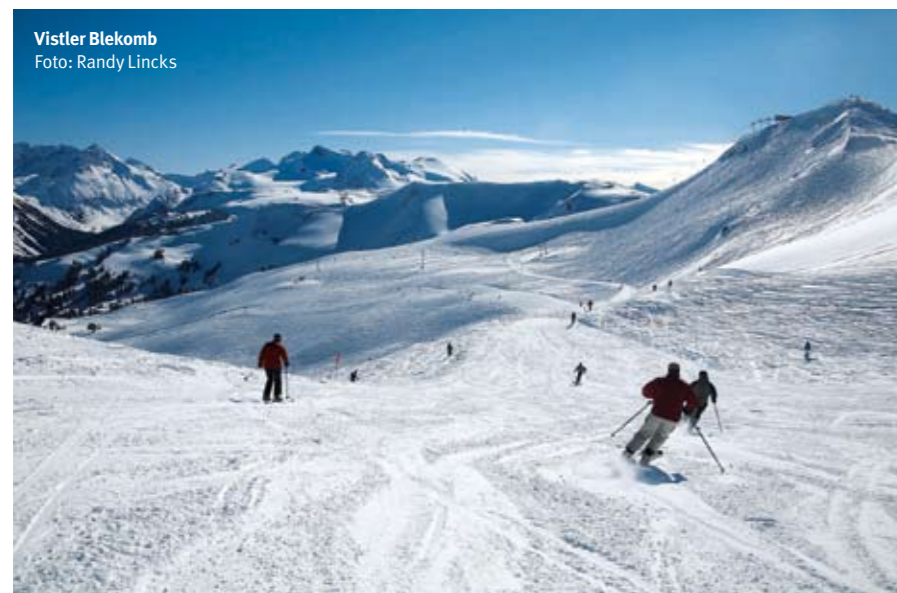
Vistler Blekomb

olimpijskim igrama u Vankuveru 2010. godine. U međuvremenu svi koji posete ovaj svetski skijaški centar zagarantovano će imati nezaboravno iskustvo na snegu. ■