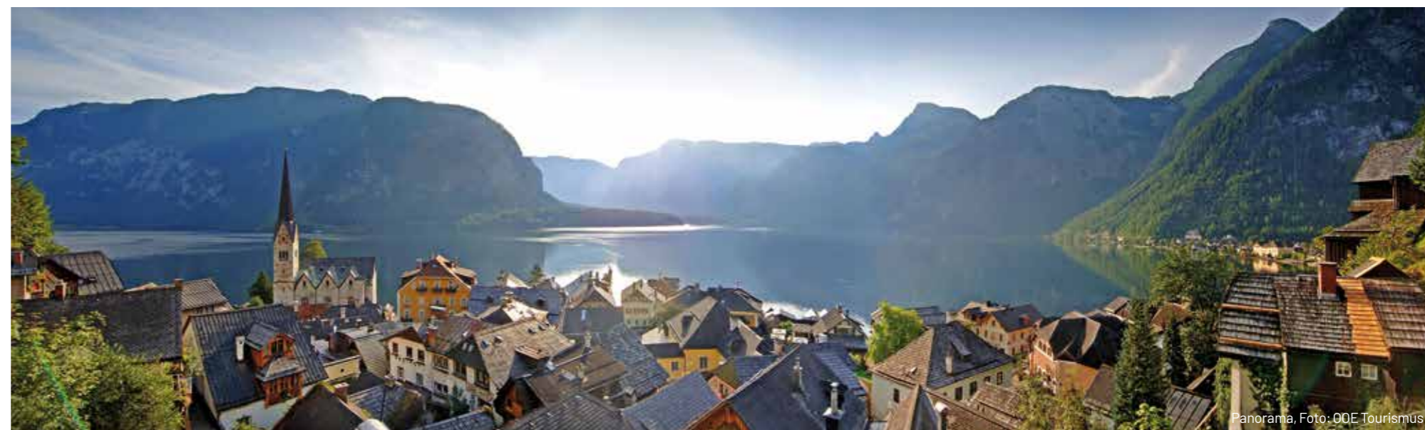
Panorama, Foto: OÖE Tourismus

Ukoliko ste ipak za nešto malo kaloričnije, predlažemo da probate austrijsku kobasicu, a uz nju popijete Hallstattbier, lokalno pivo koje nosi ime po selu, pomalo blagog ukusa, ali savršeno osvežavajuće.