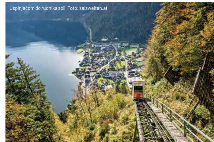
Uspinjačom do rudnika soli, Foto: salzwelten.at

Šetnju nastavite do malog seoskog trga , na kojem je statua Svetog Trojstva , postavljena davne 1743. godine. Oko nje se nalaze suvenirnice i simpatični restorani, u kojima možete napraviti predah.