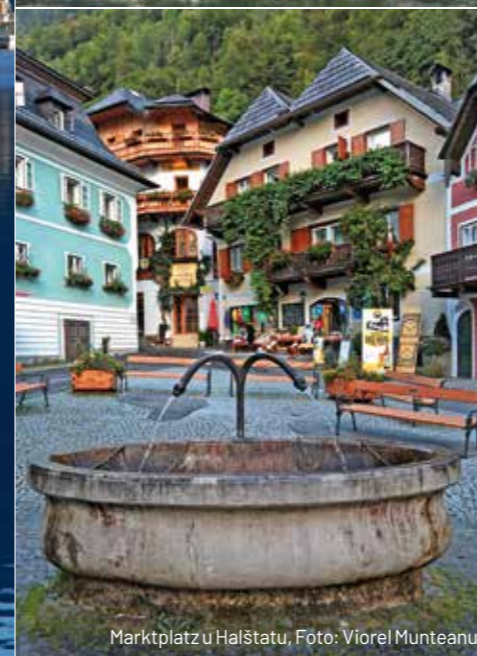
Marktplatz u Halštatu, Foto: Viorel Munteanu