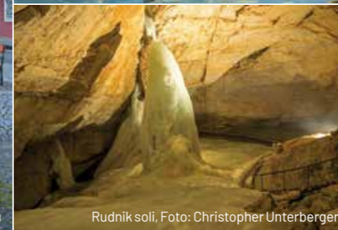
Rudnik soli, Foto: Christopher Unterberger

Jezero Halštata je jedna od glavnih atrakcija ovog sela, a iznajmljivanje brodića moguće je po cenama od oko 20 evra, što bi vam sigurno omogućilo zanimljivo popodne. Izlet do Obertrauma, ili jednostavno - uživanje na vodi i u zanimljivom pogledu!