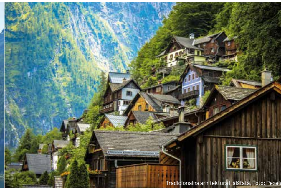
Tradicionalna arhitektura Halštata