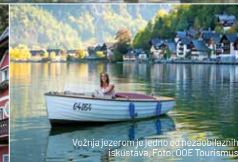
Vožnja jezerom je jedno od nezaobilaznih iskustava