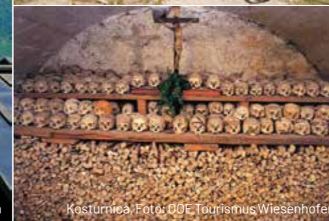
Kosturnica, Foto: OÖE Tourismus Wiesenhofer