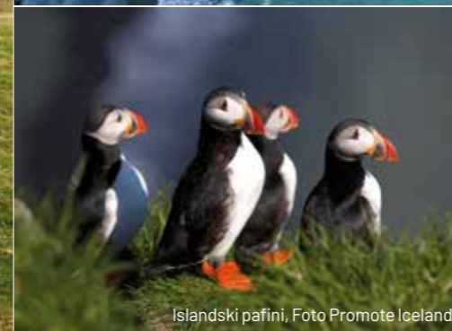
Islandski pafini