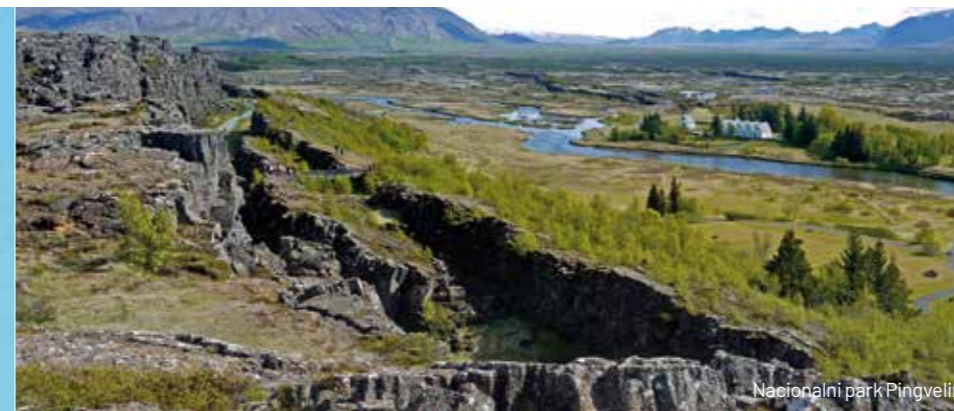
Nacionalni park Þingvellir