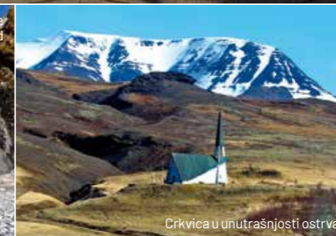
Crkvice u unutrašnjosti ostrva

sa kojom smo se i detaljno upoznali). Uz hidroelektrane, 92% energije je "zeleno", što predstavlja najveći procenat na svetu. Toliko su energetske bogati, da ostvaruju veliku zaradu izvozom struje u Britaniju, podmorskim kablom.