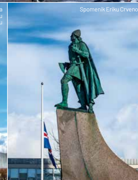
Spomenik Eriku Crvenom