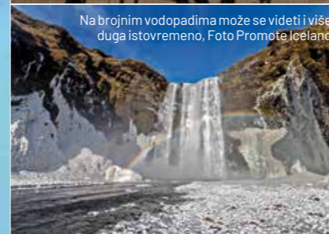
Na brojnim vodopadima može se videti i više duga istovremeno