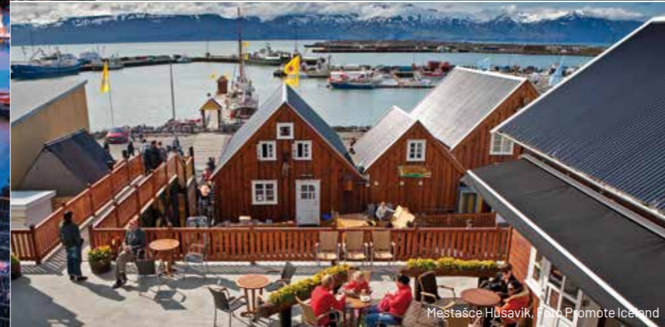
Mestašce Husavík