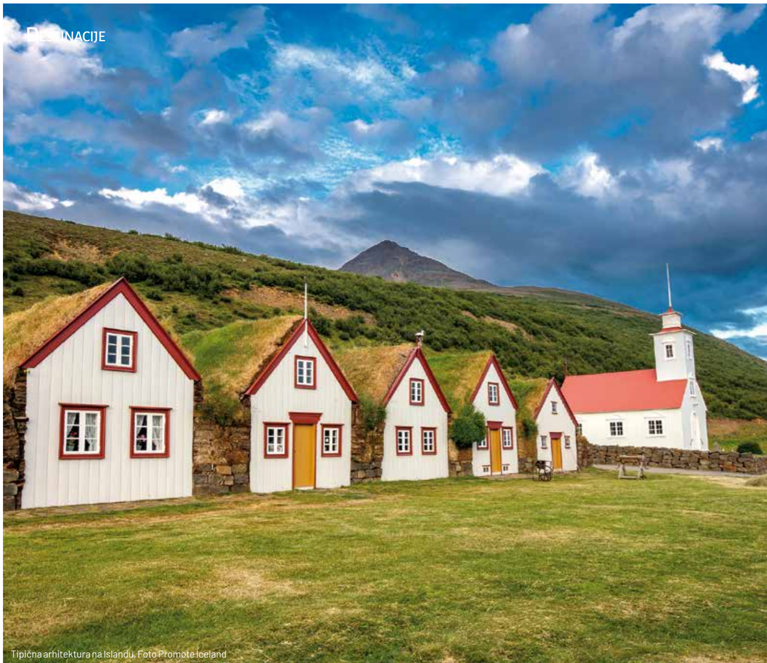
Tipična arhitektura na Islandu