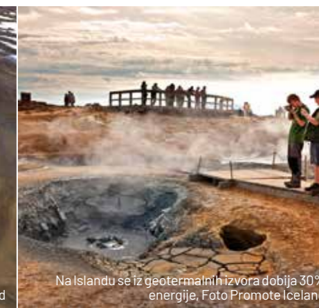
Na Islandu se iz geotermalnih izvora dobija 30% energije