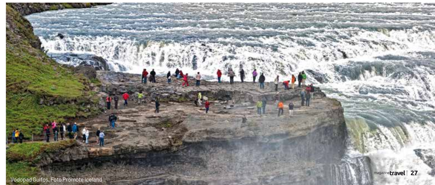
Vodopad Gulfos, Foto Promote Iceland

U današnjem nacionalnom parku Þingvellir , osnovanom 1928. godine, blizu