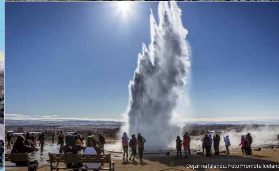
Gejzir na Islandu