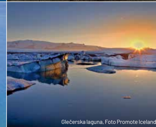
Glečerska laguna