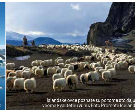
Islandske ovce poznate su po tome što daju veoma kvalitetnu vunu