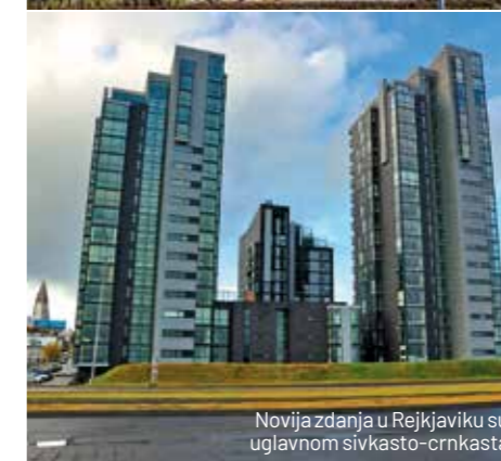
Novija zdanja u Reykjaviku su uglavnom sivkasto-crnkasta