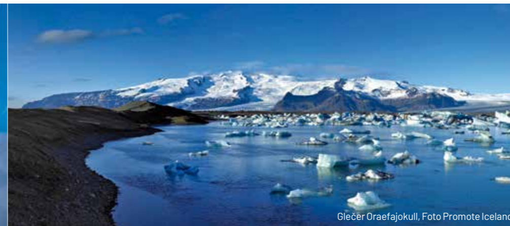
Glečer Oraefajokull