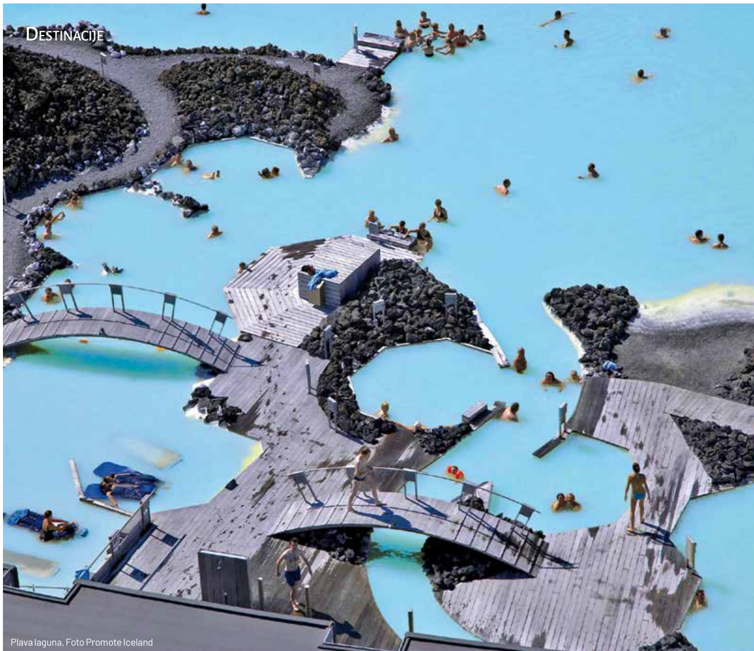
Plava laguna