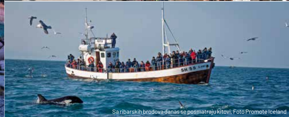
Sa ribarskih brodova danas se posmatraju kitovi

videli kitove, bilo je divno ploviti po Severnom ledenom okeanu i osmatrati. Postoji desetak vrsta kitova, od kojih se neke više viđaju zimi, a druge leti. E od ovih letnjih (bio je avgust), videli smo dva različita primerka za nekoliko sati vožnje, od kojih je jedan bio dug oko osam, a drugi oko pet metara.