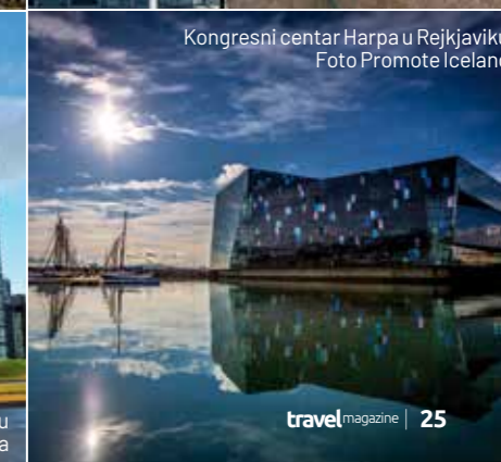
Kongresni centar Harpa u Reykjaviku