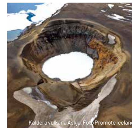
Kaldera vulkana Askja