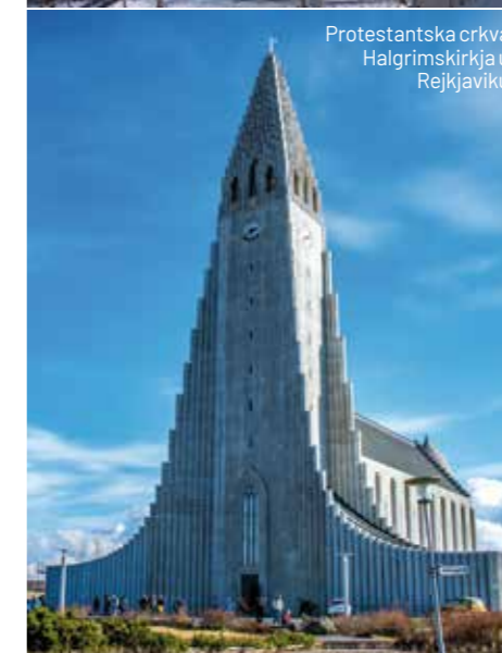
Protestantska crkva Halgrimskirkja u Reykjaviku