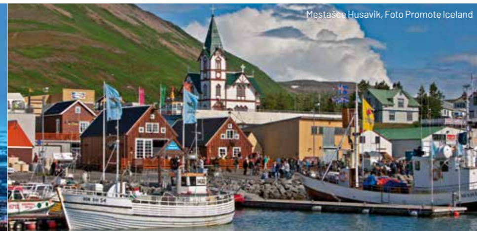
Mestašce Husavík