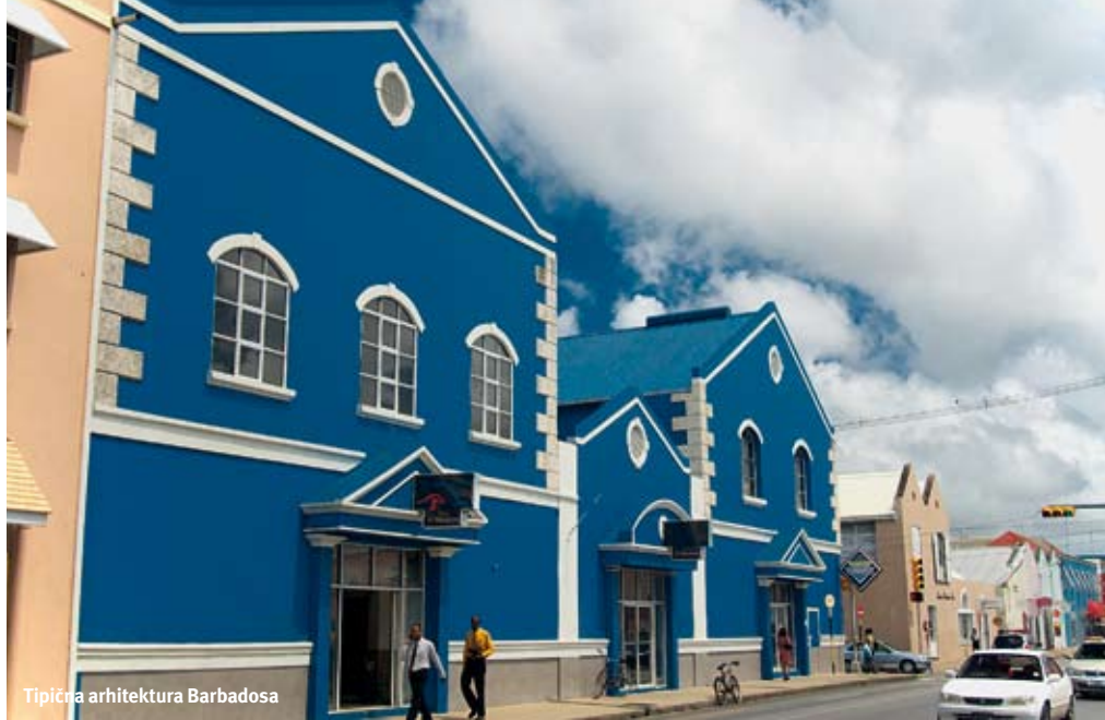
Tipična arhitektura Barbadosa

Severni i istočni deo ostrva je najmanje posećen. Budući da je oivičen Atlantskim okeanom, karakterišu ga jake struje, tako da je to atraktivno samo velikim avanturistima i surferima. Tako, svi oni koji žele da pobegnu od vreve i gužve juga i zapada za svega tridesetak minuta autobusom ili taksijem mogu doći do ovog dela ostrva. Ukoliko se odlučite da posetite istočnu obalu nezaobilazan je gradić Batšeba (Bathsheba). Sa svega 5.000 stanovnika meka je surferima i onima koji vole da posmatraju veštine ovih sportista. Svake godine se održava domaće i međunarodno takmičenje u surfvanju na poznatoj plaži Soup Boul (Soup Bowl).