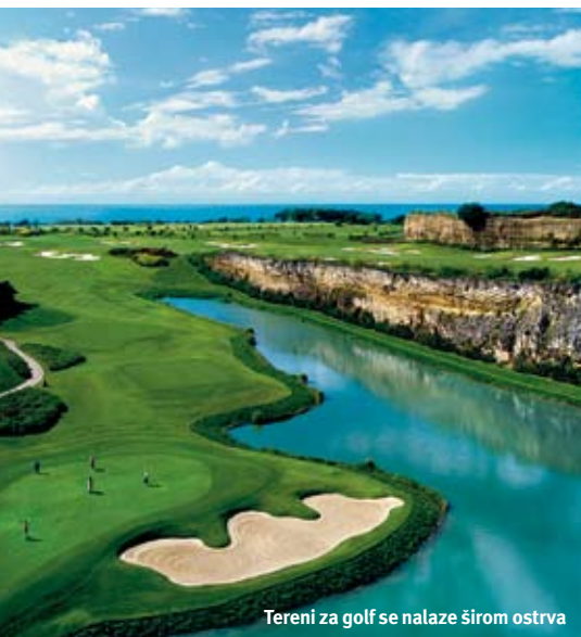
Tereni za golf se nalaze širom ostrva

samom putu smo se mimoišli sa ponekim džipom i kabrioletom. Uživala sam gledajući kroz prozor. Nisam bila svesna kako je more blizu, dok se sasvim iznenada nije pojavio prizor najbeljeg peska i reda palmi kako se nadvijaju nad tirkiznim morem. Vozač je pretpostavio da smo iznenađeni i sa vrlo specifičnim akcentom rekao: "Čekajte da vidite plaže tamo gde idete." Rekao nam je da je u junu kišna sezona, sa dosta vlage i velikih vrućina. To je za lokalce vreme kada mogu da se opuste od velike najezde turista, ali i da se pripreme za visoku sezonu koja dolazi u decembru i traje do kraja maja.