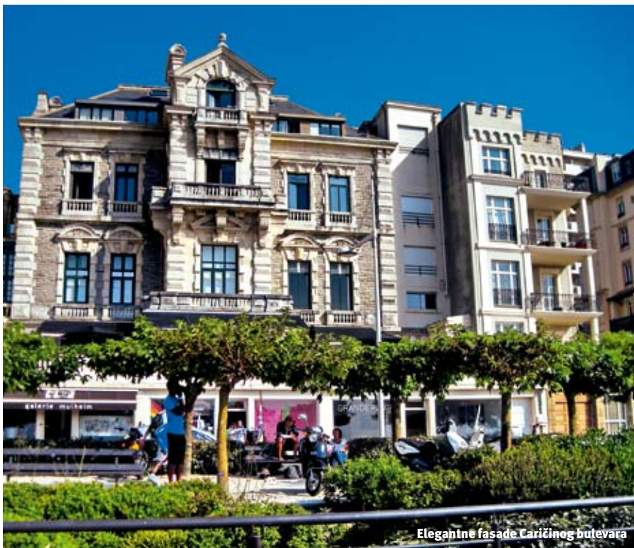
Elegantne fasade Caričinog bulevara

objašnjenje. Naime, ovaj deo Francuske nije Francuzima bio uopšte bitan za razvoj industrije, i ostao je pastoralan. Ne čudi što su ovde, u "Pays Basque Français", golf tereni i letovališta. Kao druga zemlja. Pa i jeste druga zemlja. Iako je i ovo Baskija.