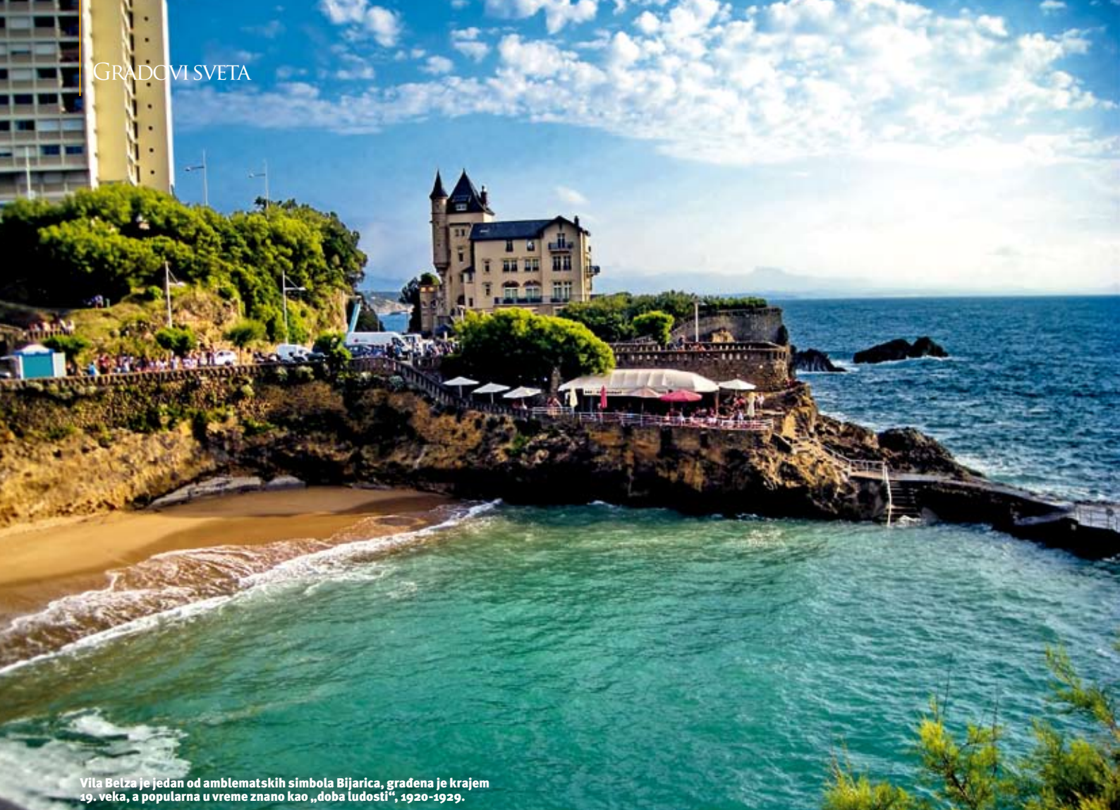
Vila Belza je jedan od amblematskih simbola Brijunika, građena je krajem 19. veka, a popularna u vreme znano kao „doba ludosti“, 1920-1929.