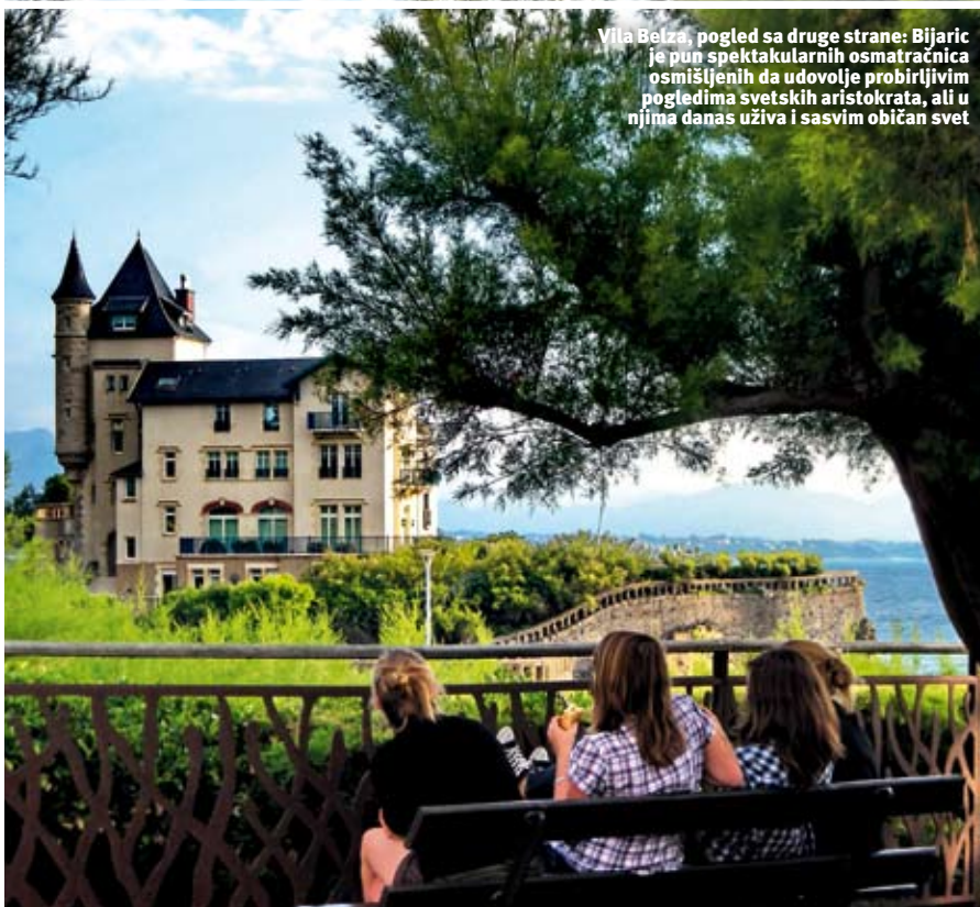
Villa Belza, pogled sa druge strane: Biaric je pun spektakularnih osmatračnica osmišljenih da udovolje probirljivim pogledima svetskih aristokrata, ali u njima danas uživa i sasvim običan svet

Kazino (Casino Barrière de Biarritz) u Bijaricu otvoren je 10. avgusta 1901. godine i samo je doprineo da u kombinaciji sa plažama dobijemo stecište evropskih turista i onih sa Istočne obale SAD: oni sa Zapadne obale mislili su uglavnom po Kaliforniji već tad, divljom oblašću sa velikom budućnošću. Tada se pojavio i zanimljiv sport pod imenom surfovanje, i horde ljudi sa daskama u rukama pohrlile su na Atlantik da bi uživali u velikim talasima koji su omogućavali kvalitetno surfovanje. Okeanski talasi su okeanski talasi, mnogo su veći od bilo kojih morskih, jer je površina vode mnogo veća. Rodio se i noćni život, a pošto je surferska kultura suštinski mladalačka, Biaric je prestao da bude stecište užtogljenih starijih ljudi i dobio je neophodnu dozu mladalačke energije i životne radosti.