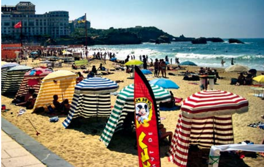
Velika plaža sa pogledom na Svetionik

Šatori umesto suncobrana? Stare tradicije aristokratskih odmarališta ne umiru lako, pa ni šarene prugice, tipične za bel-epok eru