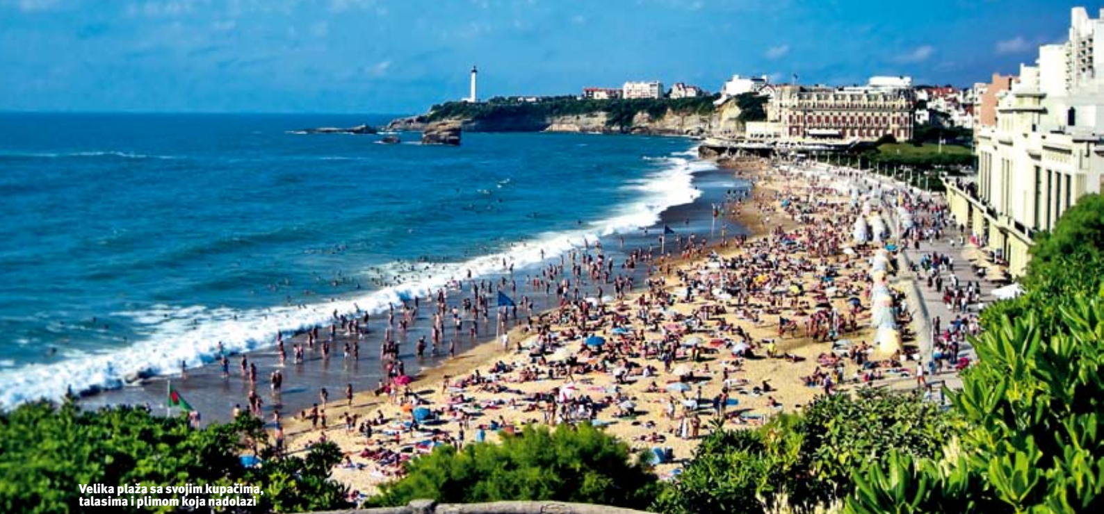
Velika plaža sa svojim kupacima, talasima i plimom koja nadolazi

Ili vas talas može "izbubecati" po pesku plicaka koji ostavlja posledice na kožu poput šmirgl-papira kad vas talas baci na njega u punoj brzini.