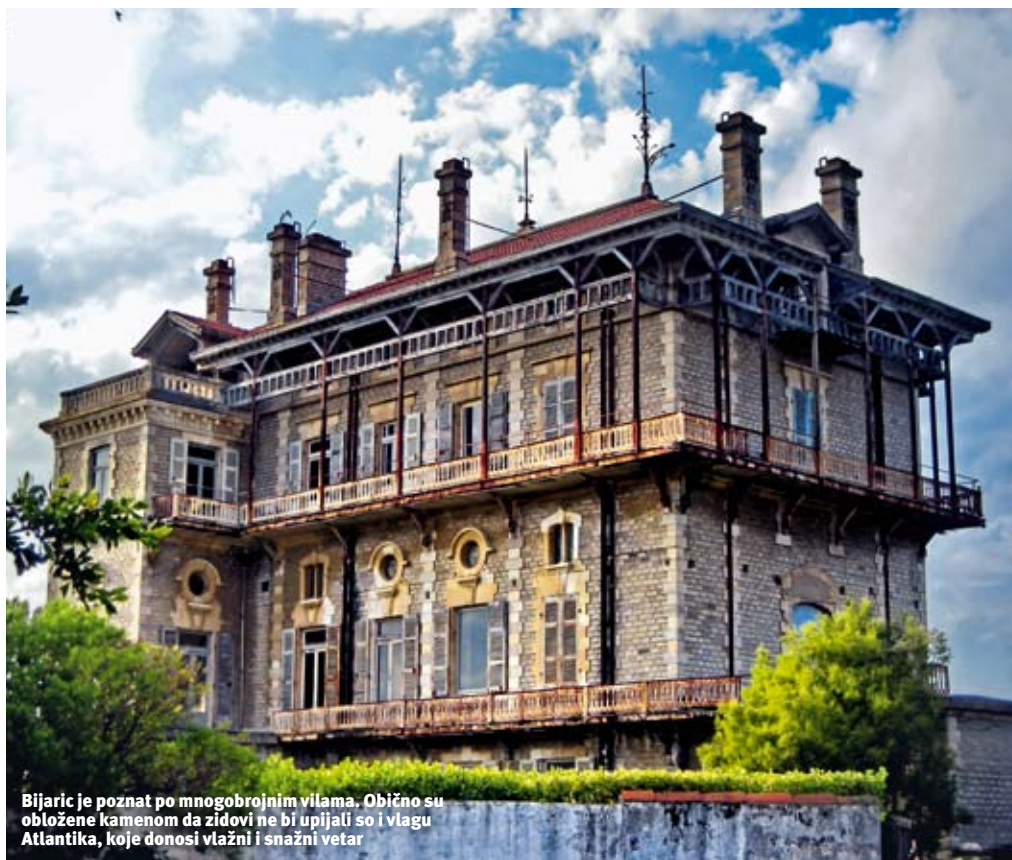
Biarritz je poznat po mnogobrojnim vilama. Obično su obložene kamenom da zidovi ne bi upijali so i vlagu Atlantika, koje donosi vlažni i snažni vetar

Ceo grad je elegantan, ali malen. Sav potiče iz ere belle-époque, a poznato je da je to bila era velike elegancije u arhitekturi, koja je istovremeno postala "industrijska", sa "štancanim", ali lepim zgradama, sa svim mogućim beneficijama Novog doba koje je demokratizovalo zabavu. Biarritz je pravi mondenski, francuski grad. Sa monumentalnim "retreat" vilama i hotelima, kakav je Hôtel du Palais, na obali. Na Aveniji carice (Avenue Empress), u zemlji koja je već duže vreme republika, jasno vam je kako se stanovnici Biarritza osećaju pri pomisli na njima dragu monarhiju iz 19. veka. Euhenija de Montijo, lepa žena cara Napoleona III, odlučila je da ovdje napravi vilu i nazove je po sebi - Ville Eugénie , a ova će vremenom prerasti u pomenuti hotel,