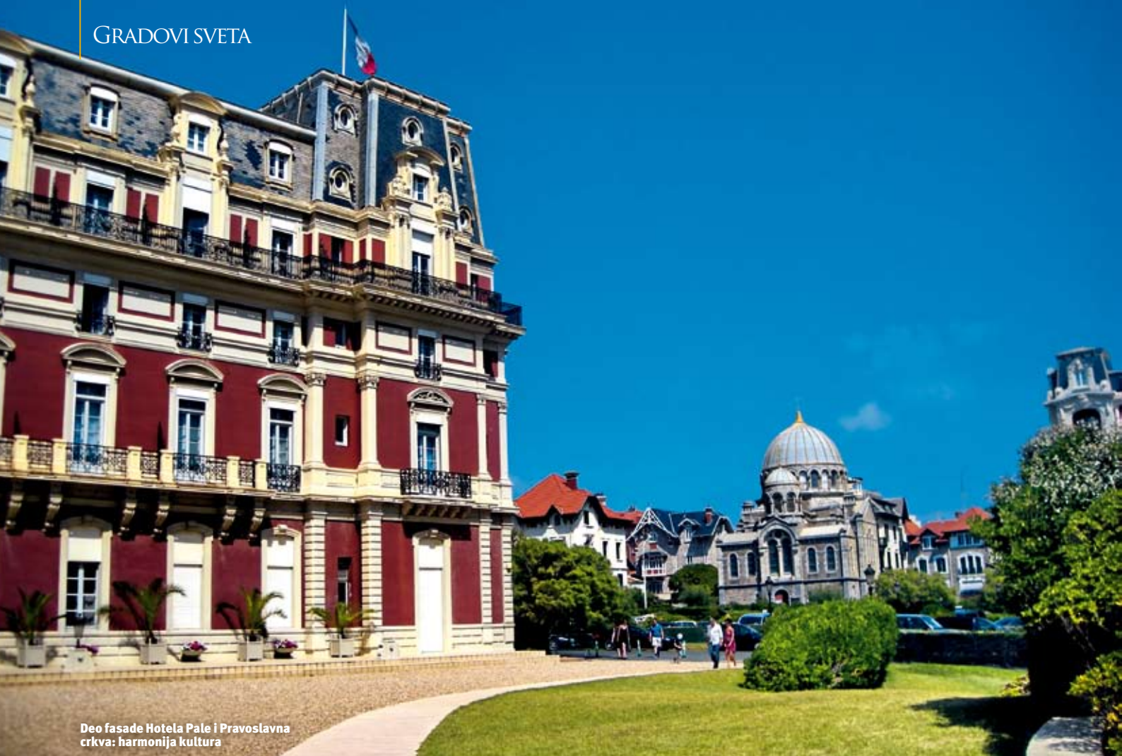
Deo fasade Hotela Pale i Pravoslavna crkva: harmonija kultura

koje se jednako igraju loptom na Grande Plage, to jest Velikoj plaži .