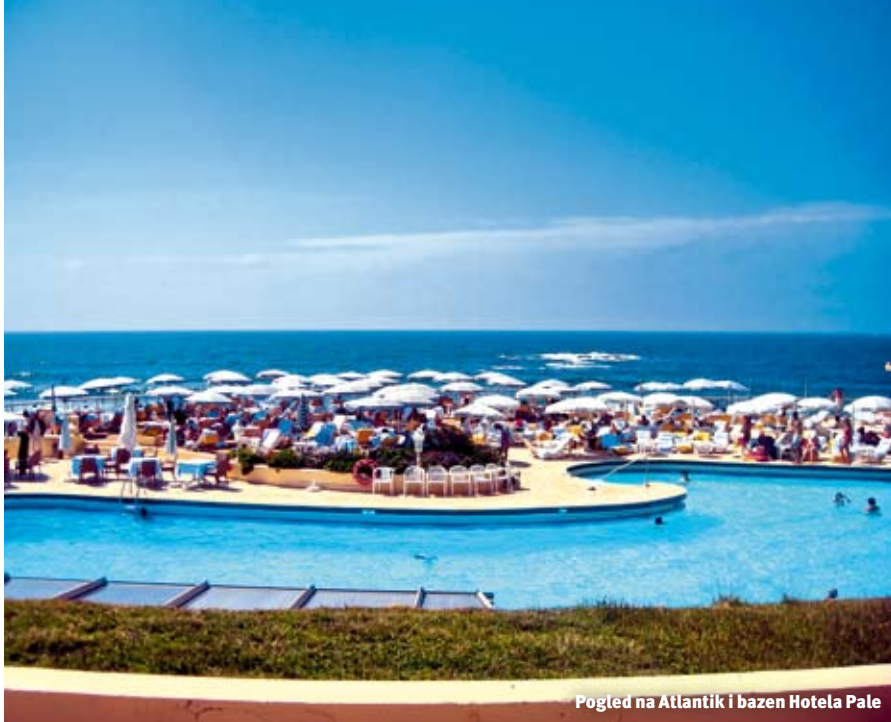
Pogled na Atlantik i bazen Hotela Pale