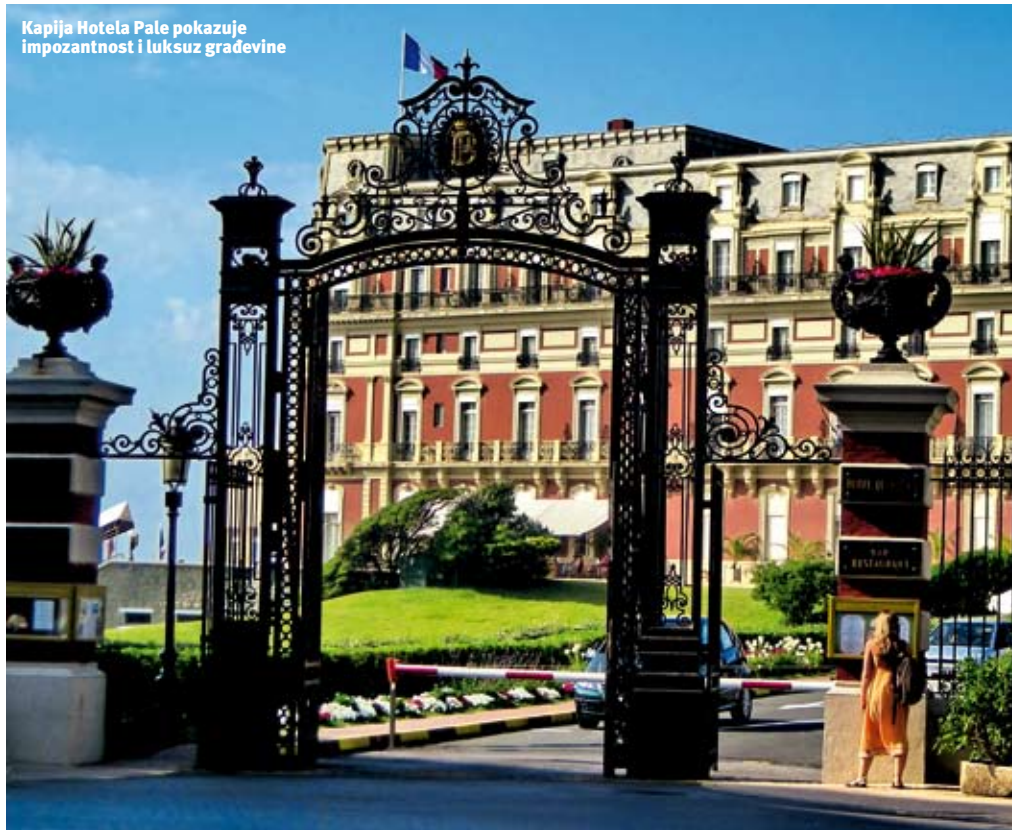
Kapija Hotela Pale pokazuje imponzantnost i luksuz gradevine

Britanska kraljevska porodica je u to vreme počela da se brine za svoje telesno zdravlje i da smatra Francusku svojim prijateljem, za promenu, pa su se i britanske krunisane glave odmarale u Bijaricu. Kraljicu Viktoriju mogli ste, da ste bili živi u to doba, videti kako se šeta pored mora, Edvard VII je bio čest gost, a tu su bili i španski monarsi, recimo Alfonso XIII je baš voleo da iz San Sebastijana skoči kraljevskim kočijama do Bijarica. Evo omanjeg spiska ljudi koji su dolazili da se odmaraju ovde, najčešće u pomenutom hotelu, koji nosi ime palate: kraljica Hortenzija, žena Luja Bonaparte, kralja Holandije, Viktor Igo (upadao je u poetski zanos u Bijaricu i rekao o njemu da je "belo selo sa crvenim krovovima i zelenim šalukatrama"), Leopold II od Belgije, portugalska monarhija je slala svoje suverene ovde dok ih je bilo, knez Meternih, Bizmark lično, kneginja Orlova, udovica cara Aleksandra II, Jekaterina Jurjevskaja, pa Sisi, superstar-carica Austrije i Ugarske, Moris Ravel, Sara Bernar, Stravinski, Čarli Čaplin, Žan Kokto i Ernest Hemingvej, Bing Krozbi, Sinatra i Gari Kuper. Nije Kan bio Kan, Bijaric je bio Kan u to doba. I sada je elegantnija verzija Azurne obale i pun neizrecivog šarma.