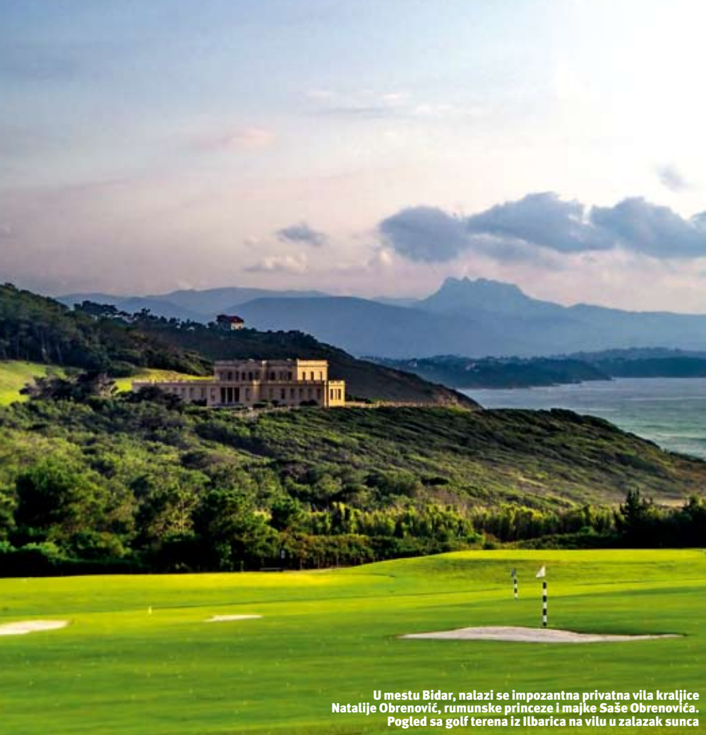
U mestu Bidar, nalazi se impozantna privatna vila kraljice Natalije Obrenović, rumunske princeze i majke Saše Obrenovića. Pogled sa golf terena iz Ilbarica na vilu u zalazak sunca

je reč o vilama i malim zamkovima. Vila Belza (Villa Belza) je na spektakularnom mestu, na steni Kašau (Cachaous) iznad jedne od malih plaža zaštićenijih od vetra, na kojoj je, pogađate, udobnije kupati se, ali ima i manje sunca i teže je naći mesto. Ali, nikada u Bijaricu nije prevelika gužva kao u masovnim odmarališnim centrima i rizortima, iako Bijaric može da se pohvali svojom dozom gužve i saobraćajnih neuroza. Vila Belza je delo Alfonsa Bertrana, iz 1895. godine, i rekli su nam da ova impozantna građevina, građena za Mari-Belzu Dibrej, zahteva gomilu novca za održavanje, jer je vetar ovde slan i vlažan, nanosi vlagu na zidove, donosi so i razjeda ih.