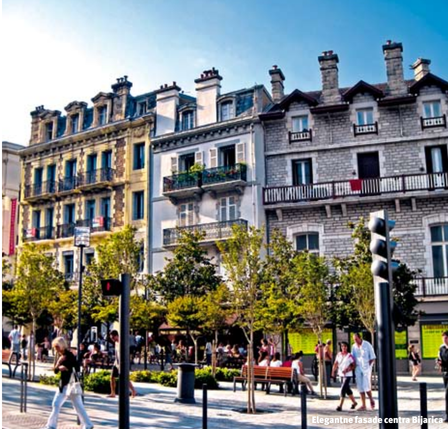
Elegantne fasade centra Bijarica