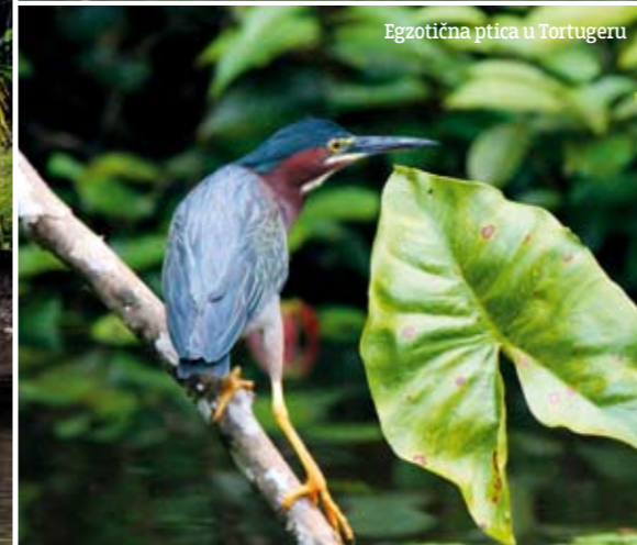
Egzotična ptica u Tortugero