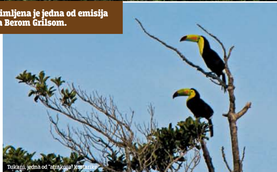
Tukani, jedna od "atrakcija" Kostarike

Uveče smo otišli u noćnu šetnju kroz prašumu, sa vodičem. Videli smo ponovo lenjivca, kao i insekta od 30 centimetara u obliku grančice drveta. To je najneverovatnija kamuflaža koju sam video. Tek kada sam dobro zagledao uspeo sam da napravim razliku između ovog insekta i grančica koje su se nalazile oko njega. Videli smo i kako je jedan insekt zgrabio drugog i počeo njime da se hrani. Oba insekta su bila ogromna i predator je držao žrtvu, a onda je odjednom pustio. Prvo sam pomislio da je žrtva uspela da se izvuče, ali nam je vodič objasnio da je u stvari predator završio sa žrtvom, to jest da je iz nje isisao svu tečnost kojom se hrani. Takođe smo visoko na granama videli