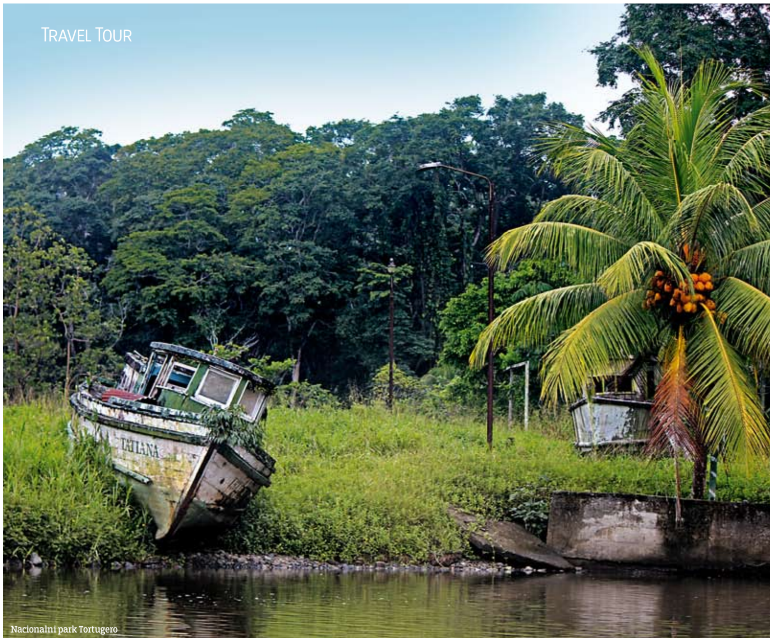
Nacionalni park Tortugero