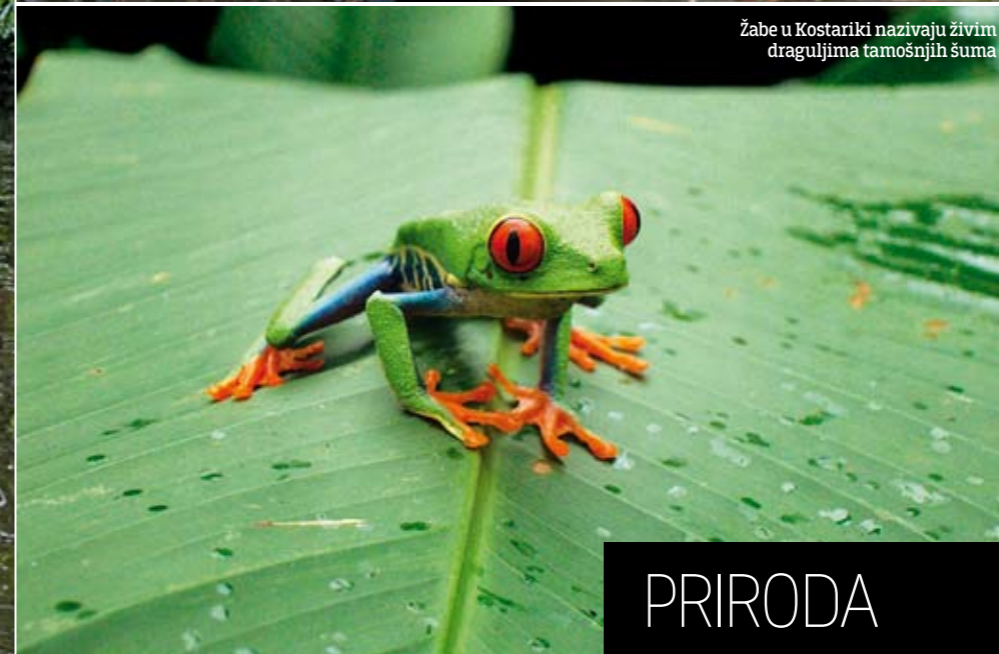
Žabe u Kostariki nazivaju živim draguljima tamošnjih šuma