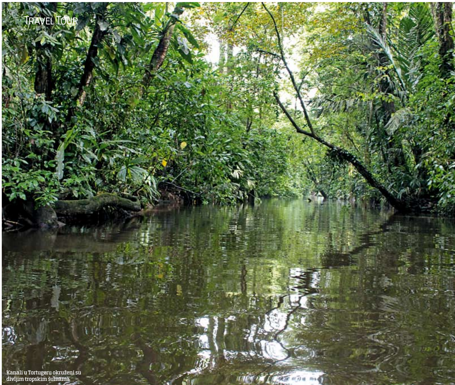
Kanali u Tortugero okruženi su divljim tropskim šumama

Naziv Kostarika (Costa Rica) na španskom znači “bogata obala”. Ovakav naziv su joj dali Španci zbog bogatstva zlatom, koje su Španci zatekli kada su stigli.