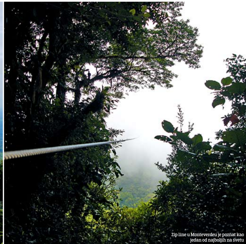
Zip line u Monteverdeu je poznat kao jedan od najboljih na svetu

- spuštanje niz vodopade. Spustio sam se niz šest vodopada različite visine, od kojih je najniži imao četiri, a najviši 40 metara. Ostali su imali oko 15 metara. Spuštanje je bilo vrlo naporno i teško, pre svega zbog toga što mi je to bio prvi put da se spuštam niz konopce. Nisam imao dobru tehniku, što je automatski značilo mnogo bespotrebnog rasipanja energije. Za vodopad, za koji je instruktorima da se spuste trebalo nekoliko sekundi, meni je trebalo 10 puta više. Kako je u to vreme bila kišna sezona vode je bilo u izobilju, tako da nije bilo lako boriti se protiv vodene bujice.