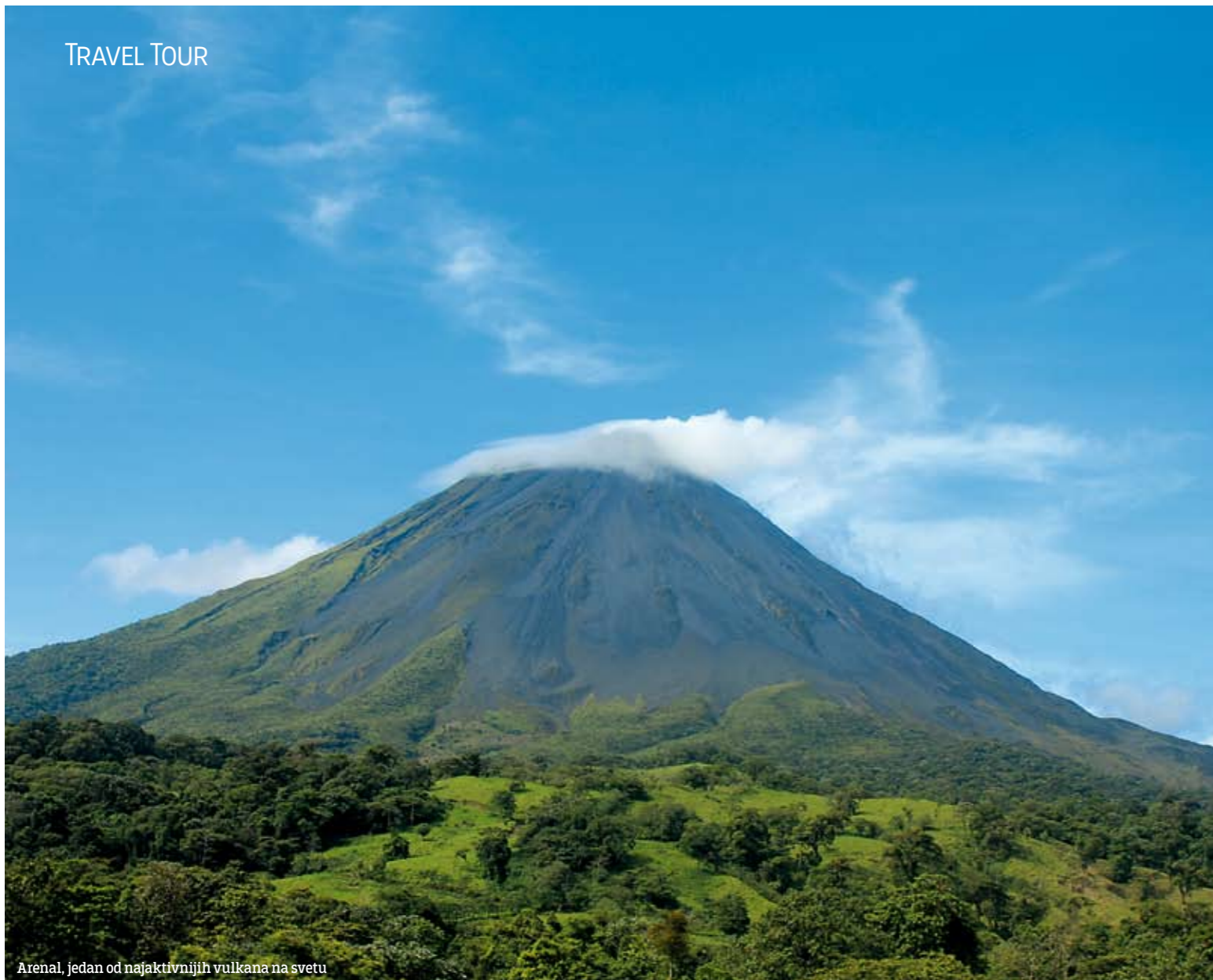
Arenal, jedan od najaktivnijih vulkana na svetu

U Kostariki ima 130 vrsta riba, 220 vrsta reptila, 1.000 vrsta leptira (10% leptira na svetu se nalazi u Kostariki), 9.000 vrsta biljaka, 20.000 vrsta paukova i 34.000 vrsta insekata.