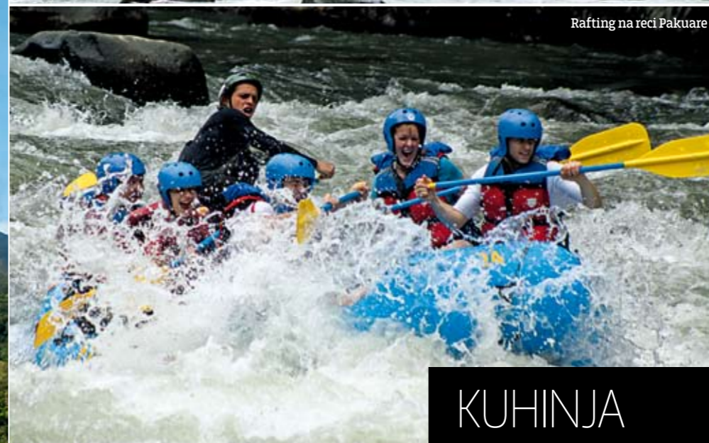
Rafting na reci Pakuare