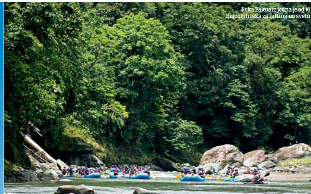
Reka Pakuare jedna je od 10 najboljih reka za rafting na svetu

Kiša je trajala nekih pet minuta i to je bio zabavni deo. Manje zabavan deo bilo je penjanje uz vulkan po blatu. Bilo je stvarno teško, ali priroda je predivna, pa je sav napor bio nagrađen. Nailazili smo na narandžaste guštere, ogromne leptire, biljke, čuli riku majmuna. Na vrh vulkana smo stigli mrtvi umorni. Konačno smo se popeli i do lagune koju, zbog guste magle, jedva da smo i videli. Planirali smo da se okupamo u njoj, ali je na vrhu bilo hladno, tako da smo odustali. Zbog magle, na žalost, nismo videli ni Arenal sa vrha Sera Čata, ali to nam nije toliko smetalo. Sama činjenica da smo se nalazili na vrhu vulkana, na oba-