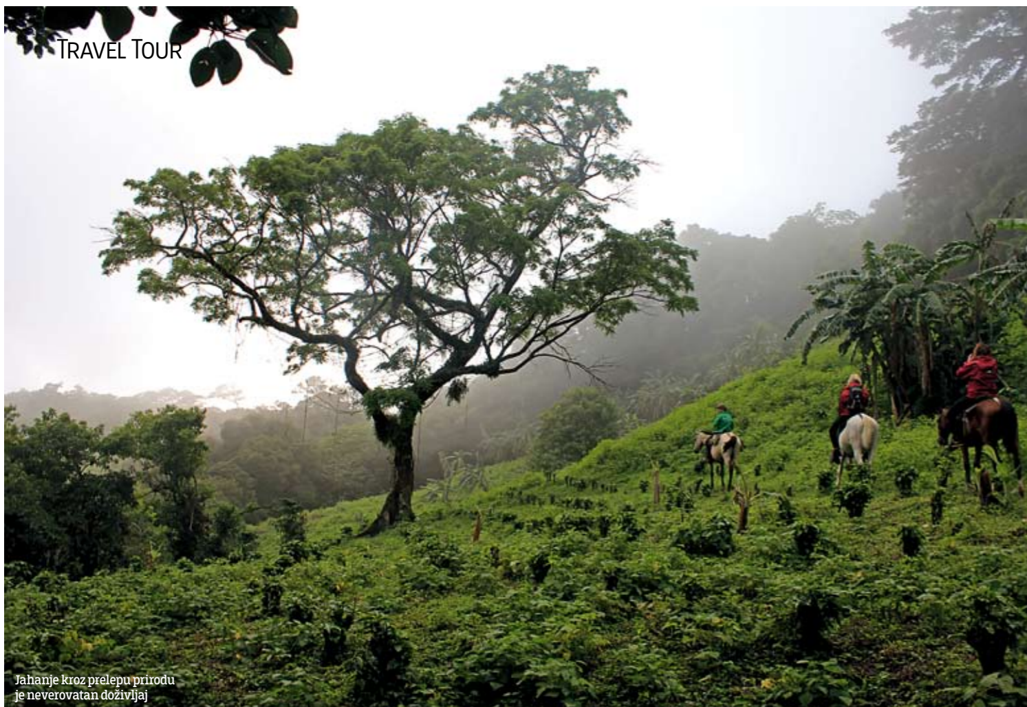
Jahanje kroz prelepu prirodu je neverovatan doživljaj

U nacionalnom parku Korkovado snimljena je jedna od emisija popularnog serijala "Survivor", sa Berom Grilsom.