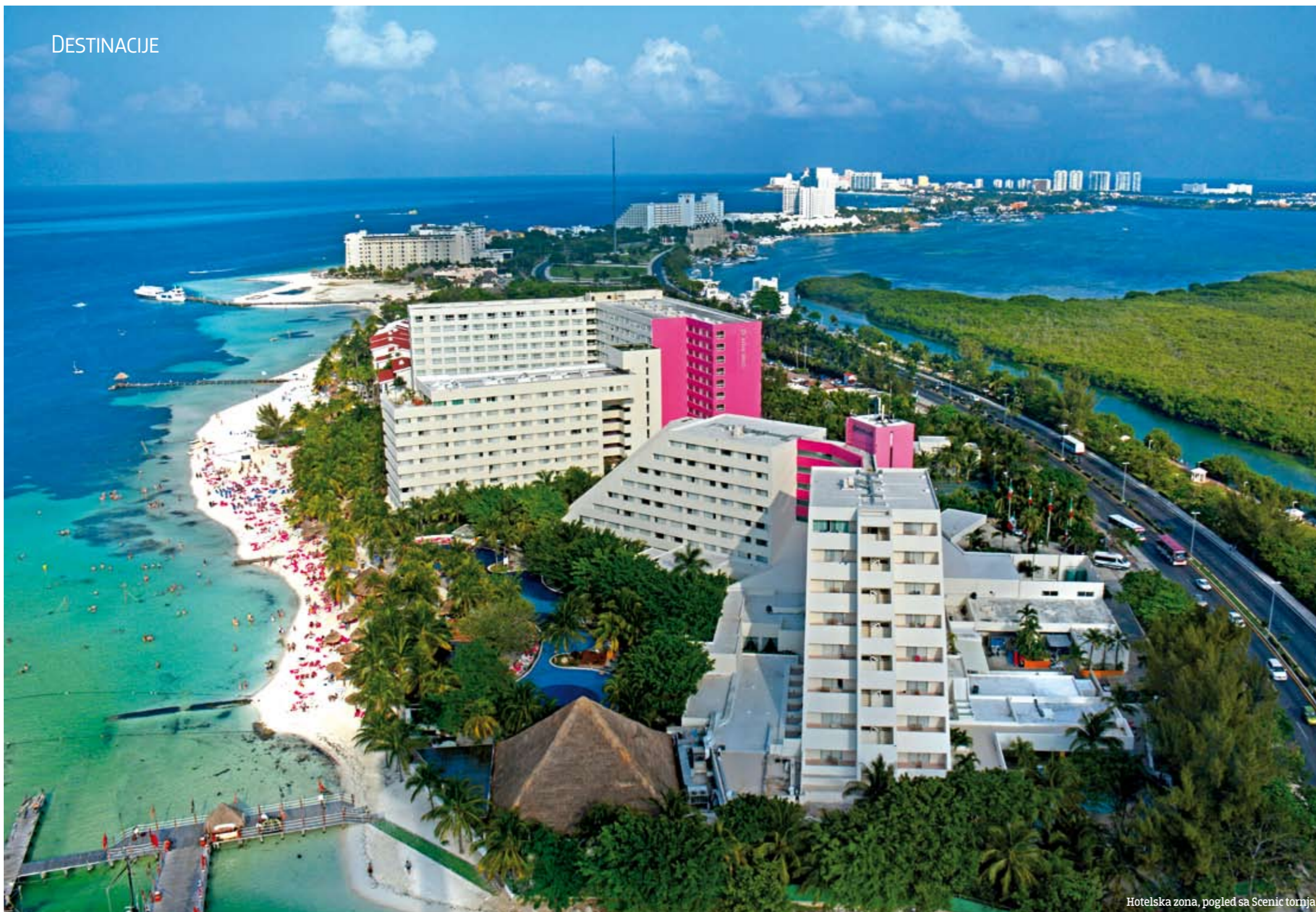
Hotelska zona, pogled sa Scenic tornja