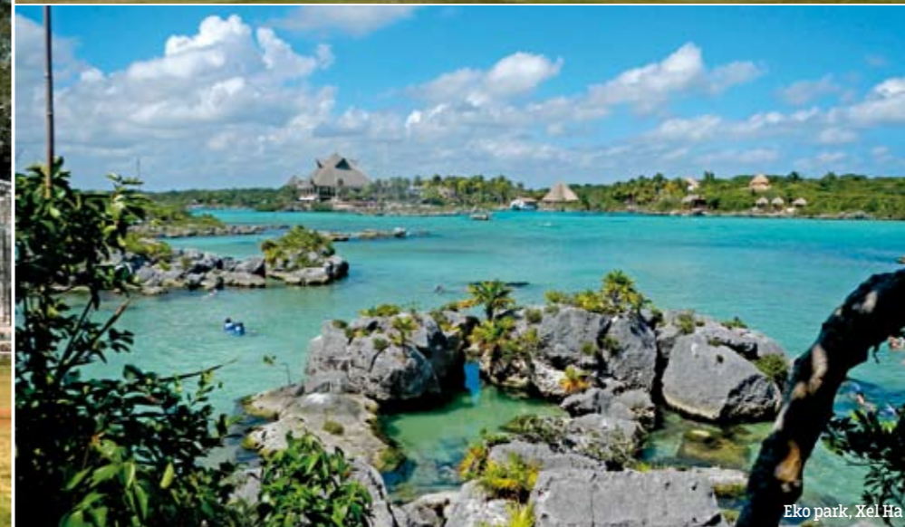
Eko park, Xel Ha