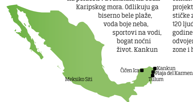
Čičen Ica Kankun Plaja del Karmen Tulum Meksiko Siti

Kankun je grad u Meksiku, u saveznoj državi Kintana Ro (Quintana Roo). Nalazi se na poluostrvu Yucatan, na obali Karipskog mora. Odlikuju ga biserno bele plaže, voda boje neba, sportovi na vodi, bogat noćni život. Kankun