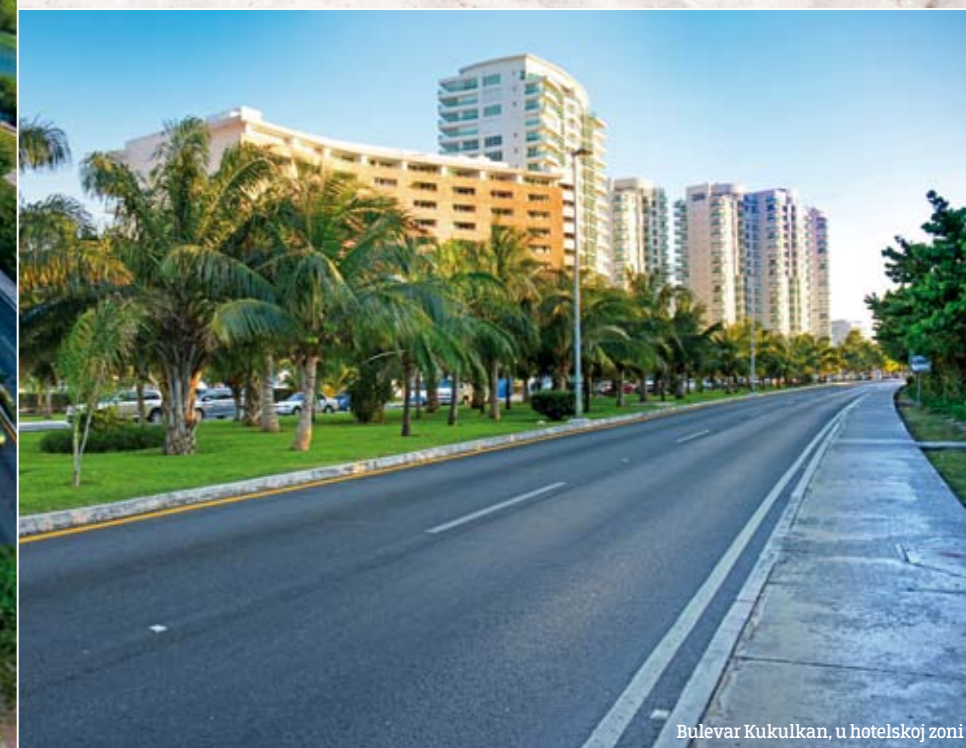
Bulevar Kukulkan, u hotelskoj zoni

Ova priča, koja je nastala nakon tromesečnog boravka jednog zaljubljenog para u Meksiku, nikako se ne može svrstati u klasične putopisne reportaže. Iako su njeni autori pokušali da nam dočaraju sve lepote ove zemlje, da nas prošetaju kroz njene turističke centre, drevne gradove i preporuča nam ponešto od njenih atrakcija, kroz redove koji slede ipak provejava nešto mnogo snažnije. Nešto zbog čega se treba zadržati na ovim stranicama, na "priči o Meksiku"