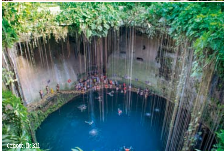
Cenote, Ik Kil

u krečnjaku, radom podzemnih voda. Ove formacije su česte i karakteristične za Jukatán u Meksiku. Zamislite da se kupate u prirodnom jezeru, koje se nalazi u pećini. Ovo je bilo stvarno nezaboravno iskustvo - kupanje, slikanje i uživanje u ovom nesvakidašnjem čudu prirode. Bližio se kraj avanture, uz laganu vožnju do Kankuna.