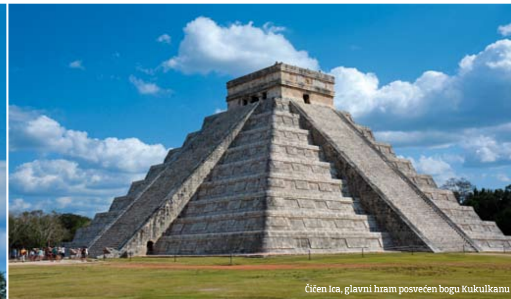
Čičen Ica, glavni hram posvećen bogu Kukulkanu