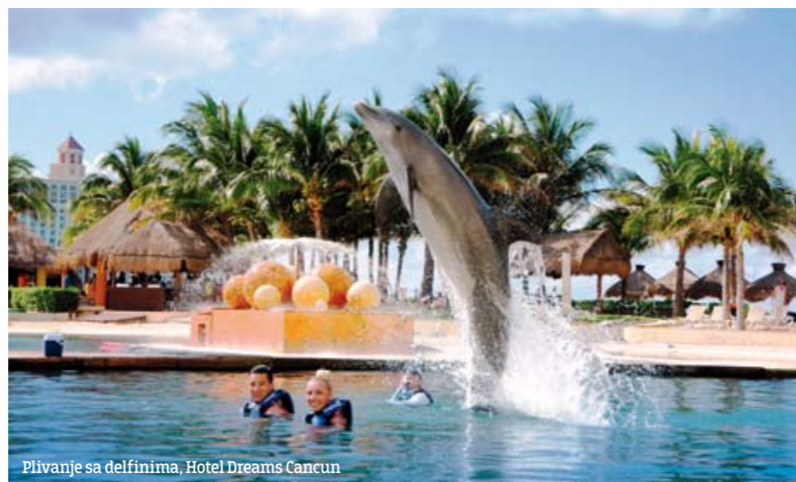
Plivanje sa delfinima, Hotel Dreams Cancun

Tekila je alkoholno piće, koje je prvi put proizvedeno u 16. veku u okolini grada Tekila . Pravi se od biljke plave agave (vrsta kaktusa) i sadrži 35-55% alkohola. U Meksiku više od 100 destilerija proizvodi 600 vrsta tekile, dok je ukupno registrovano više od 2.000 vrsta tekile. Tekila se obično klasifikuje u pet kategorija: oro (zlatna), blanco (bela), reposado (odležala), anejo (stara), ekstra anejo (ekstra stara sa određenom godinom). Naravno, što je starija, znači da je i kvalitetnija, i ima tamniju boju.