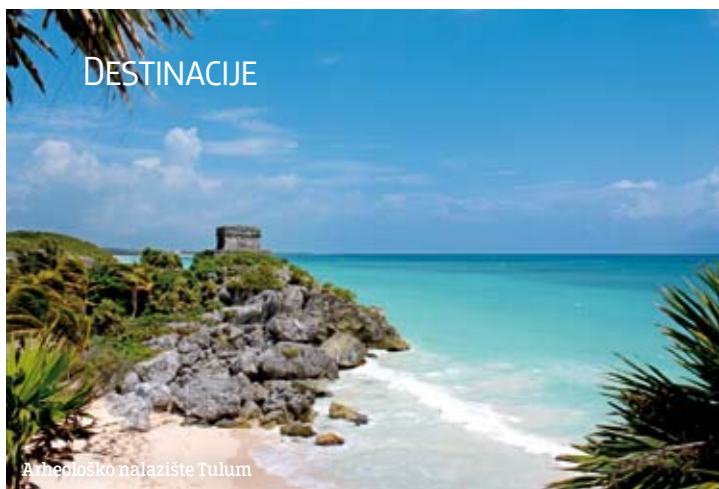
Arheološko nalazište Tulum