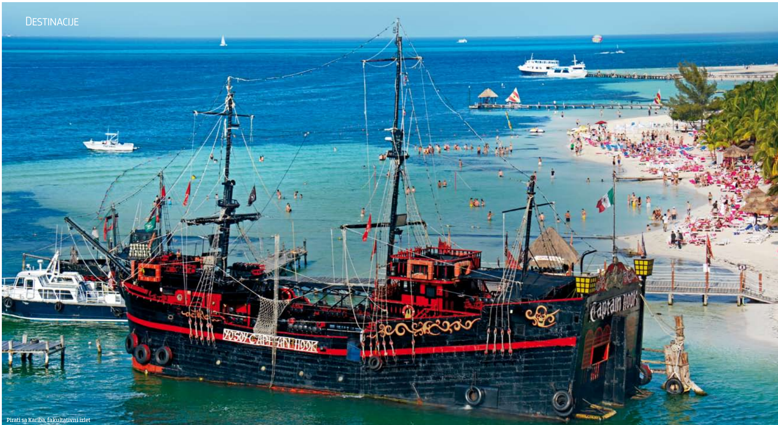
Pirati sa Kariba, fakultativni izlet

Nažalost, kod grada Kankuna koralni grebeni su mrtvi, izgubili su svoju šarenu boju zbog mnogih turista koji dolaze ovdje iz celog sveta. Godišnje više od tri miliona turista poseti Kankun, jedno od najpoznatijih turističkih mesta na svetu. Ovim putem apelujem na sve da čuvaju floru i faunu destinacije na koju putuju, i ako su u mogućnosti, kupuju sredstva za zaštitu protiv sunca sa nalepnicom "eco friendly", koja nisu štetna za podvodni svet.