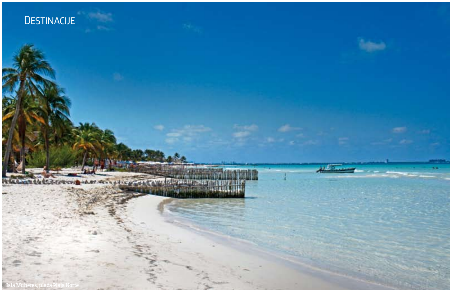
Isla Mujeres, plaža Playa Norte