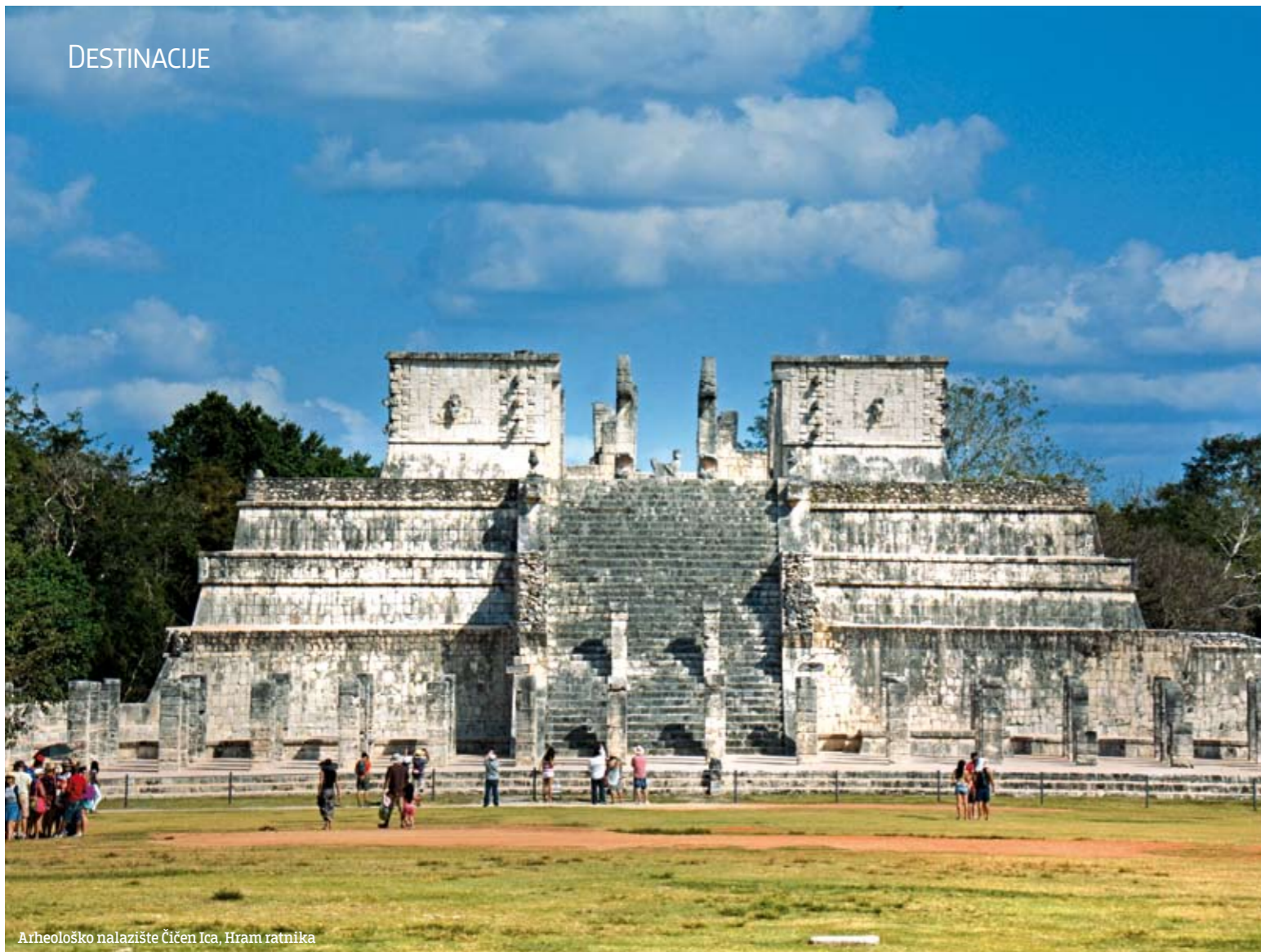
Arheološko nalazište Čičen Ica, Hram ratnika