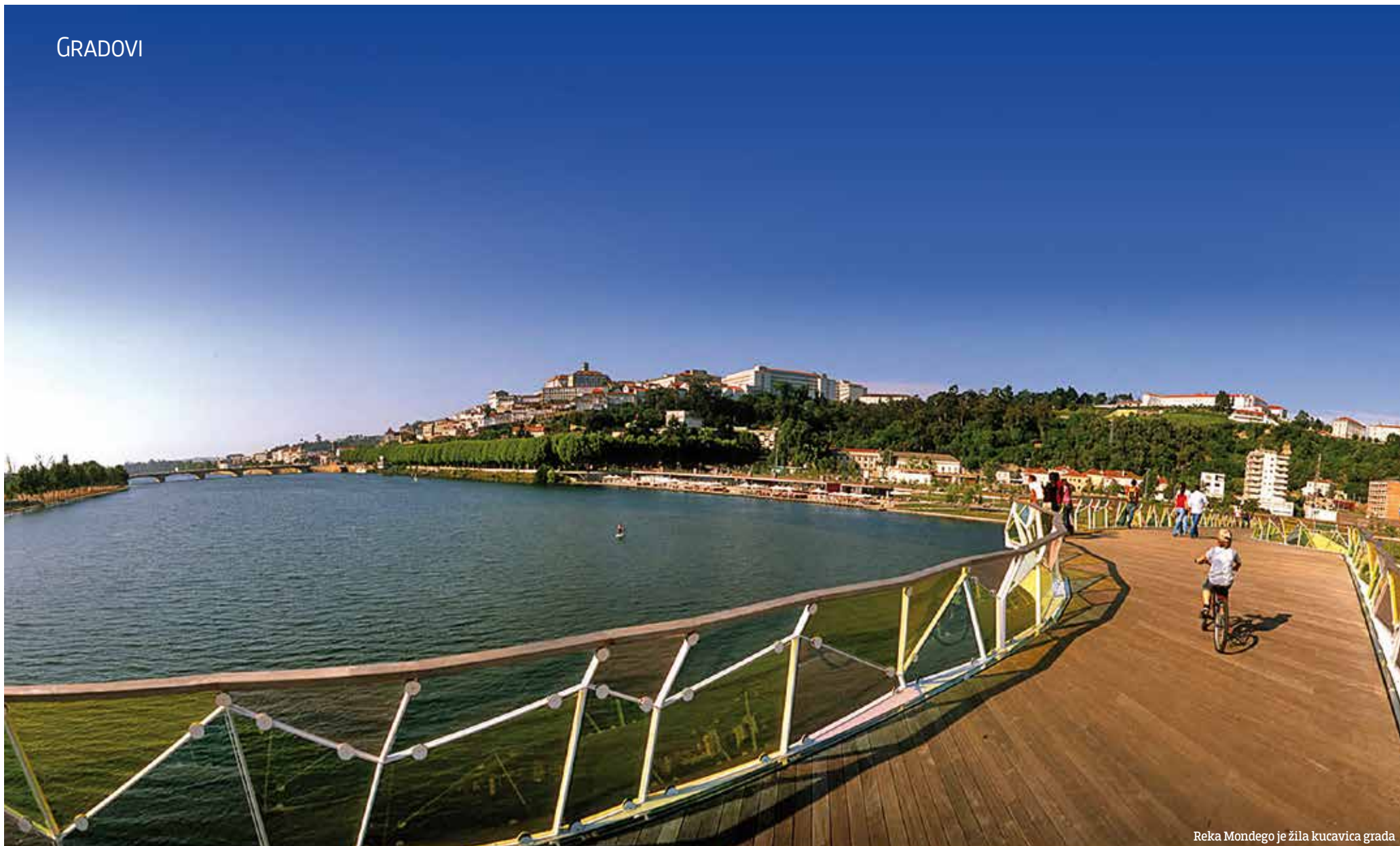
Reka Mondego je žila kucavica grada