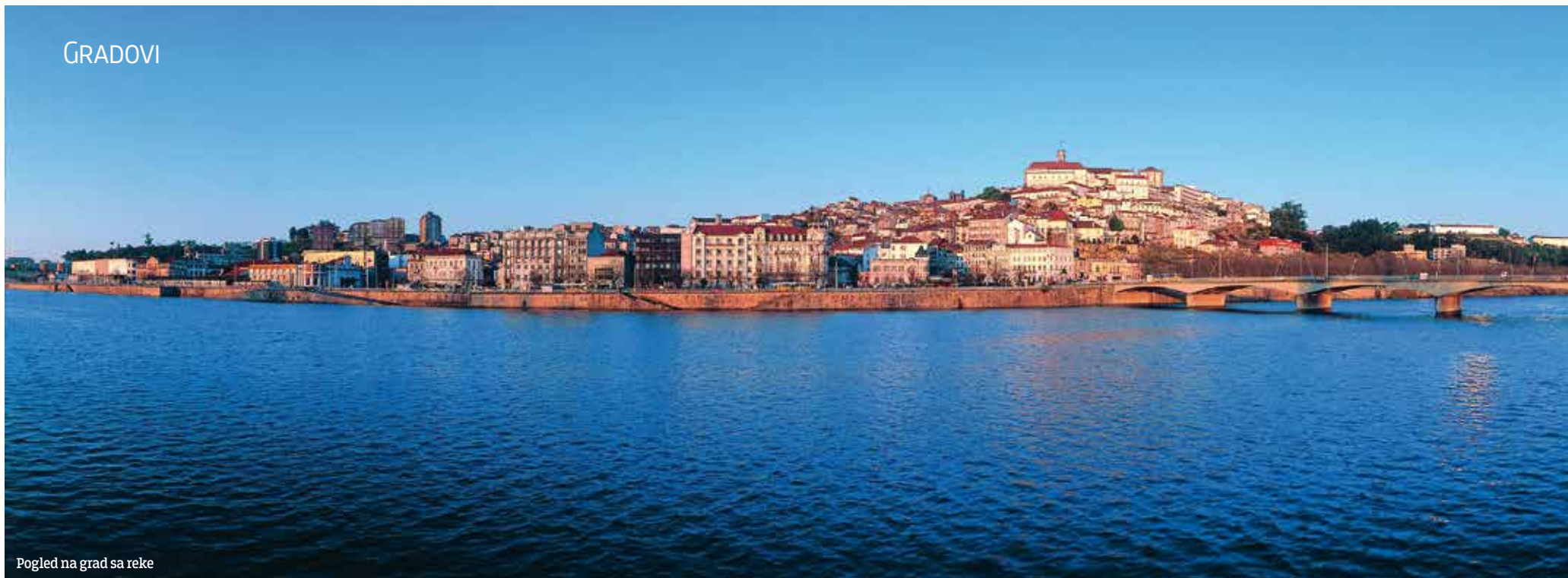
Pogled na grad sa reke