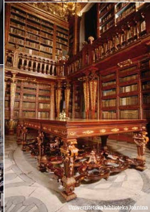
Univerzitetska biblioteka Joanina

Poznata fado pesma kaže: “Coimbra é uma lição de sonho e tradição”, odnosno: “Koimbra je lekcija o snu i tradiciji”. Nekadašnja portugalska prestonica sa bogatom istorijom, zavodljiva je baš kao fado, ali osim nostalgije za starim vremenima, u njoj ćete osetiti i mladost, energiju i polet modernog grada