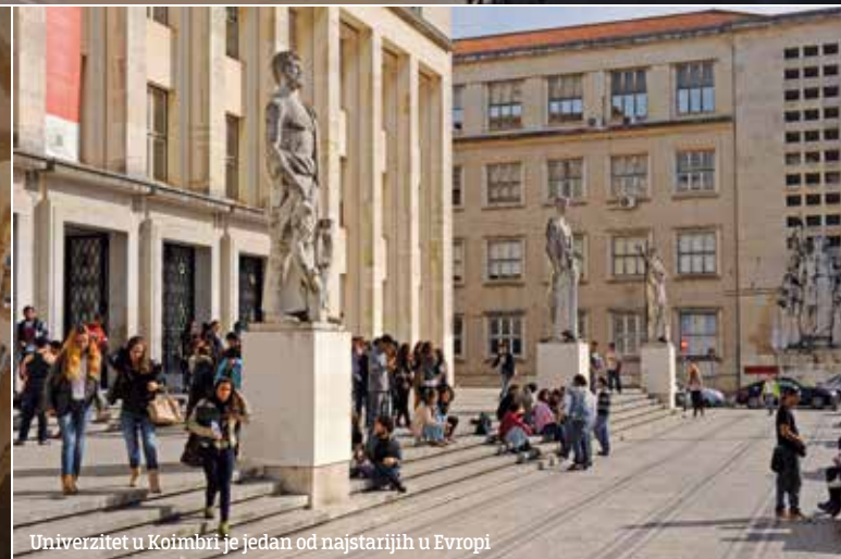
Univerzitet u Koimbri je jedan od najstarijih u Evropi