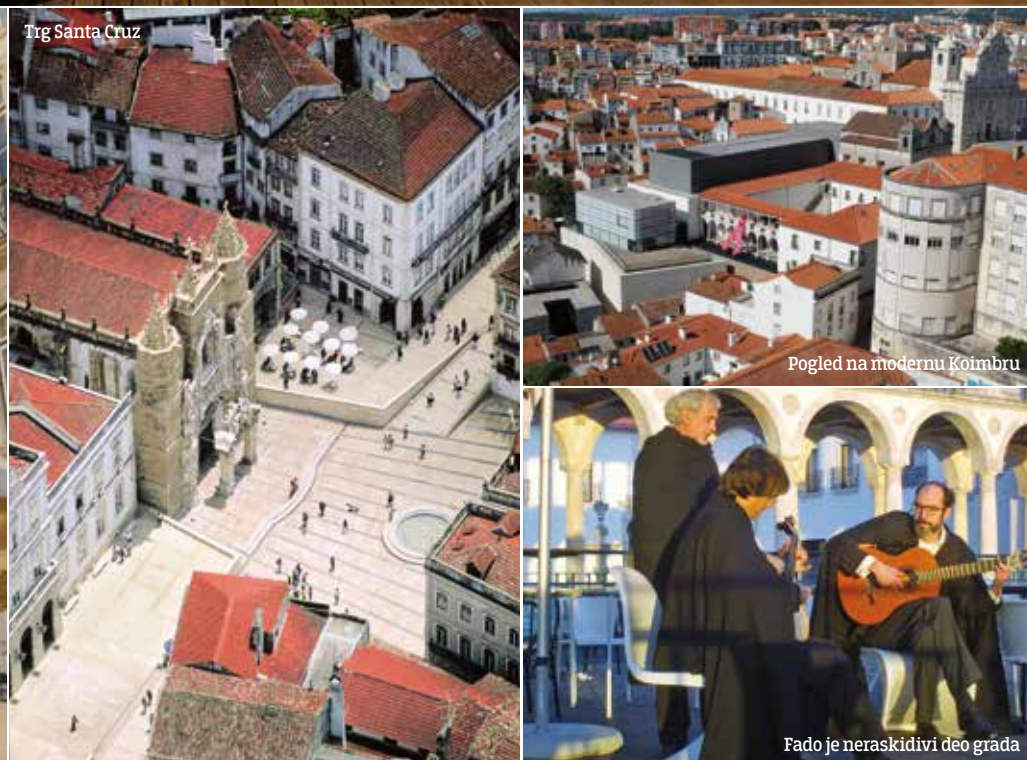
Trg Santa Cruz