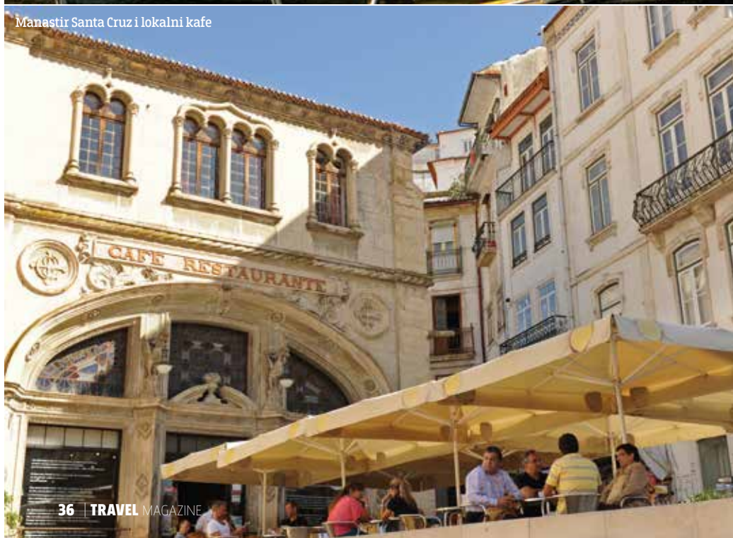
Manastir Santa Cruz i lokalni kafe