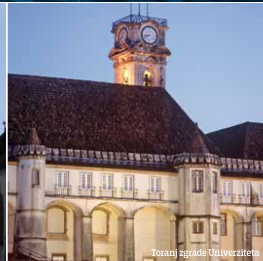
Toranj zgrade Univerziteta