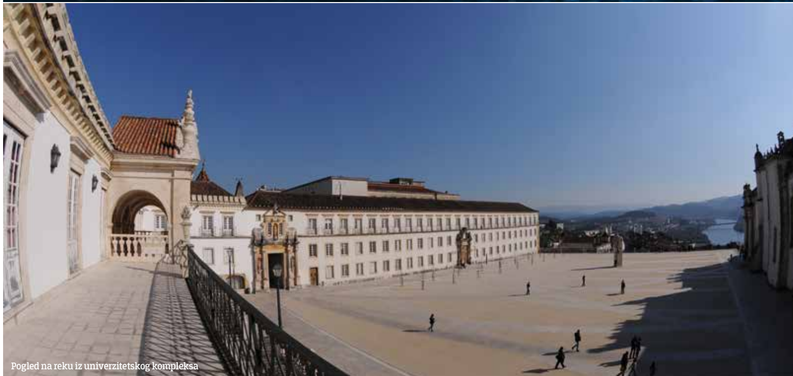
Pogled na reku iz univerzitetskog kompleksa